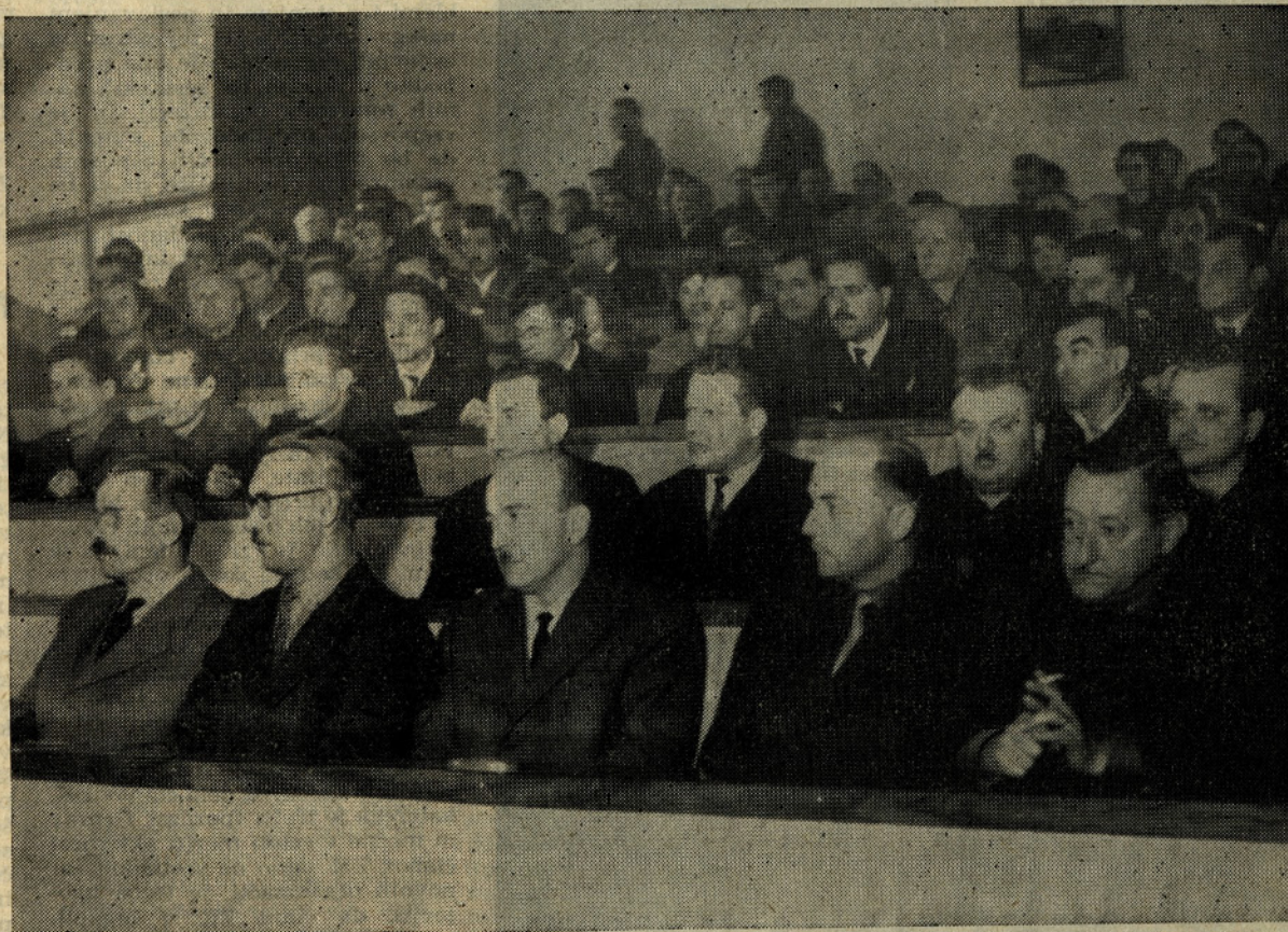
Prvi dan VIII. kongresa je naš politični aktiv poslal VIII. kongresu ZKJ pozdravno brzojavko