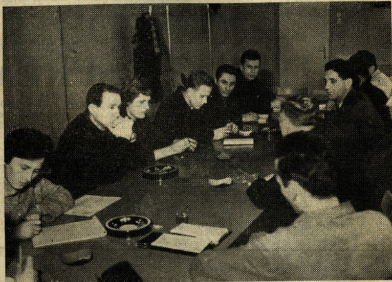
Tovarniški komite ZK

ne sprejemajo radi nalog in odgovornosti. Določeno število članov je pa takih, ki absolutno stojijo ob strani in niso nikjer vključeni oziroma nikjer ne delajo. Imamo tudi posameznike, ki si želijo, da bi bili za vse, kar so naredili, nagrajeni oziroma plačani, drugače pa nimajo časa za izvrševanje partijskih nalog oziroma so istim partijske naloge postranska stvar. Zato ni čudno, da na naše sestanke