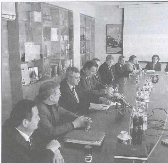
Župani pomurskih občin so podpisali pogodbo o sofinanciranju izgradnje glasbene šole v Murski Soboti.

Vrednost projekta znaša 506.870.521 tolarjev po stalnih cenah iz februarja 2006 oziroma 517.436.894 tolarjev po tekočih cenah. V teh dveh zneskih so zajeti stroški komunalno opremljenega zemljišča, priprave projektne dokumentacije, gradbenih del, nabave in montaže opreme ter stroški tehničnega nadzora. Komunalno opremljeno ureditev in vso dokumentacijo je zagotovila MOMS, medtem ko so gradbeno-obrtniška dela in nabava ter montaža opreme predmet pogodbe o sofinanciranju glasbene šole v Murski Soboti.