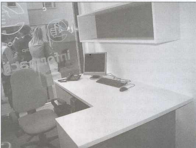
Prostori PIP-a v soboški knjižnici.