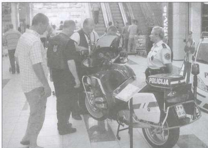
Zanimanje obiskovalcev za njihovo promocijo je bilo zelo veliko.

Da bi delo policistov kar najbolj približali širšemu krogu ljudi, po drugi strani pa animirali mlade, da se morda odločijo za ta zanimivi poklic, so v BTC-u v Murski Soboti pripravili nekajdnevno razstavo o delu policistov, še posebej tistih z motorji.