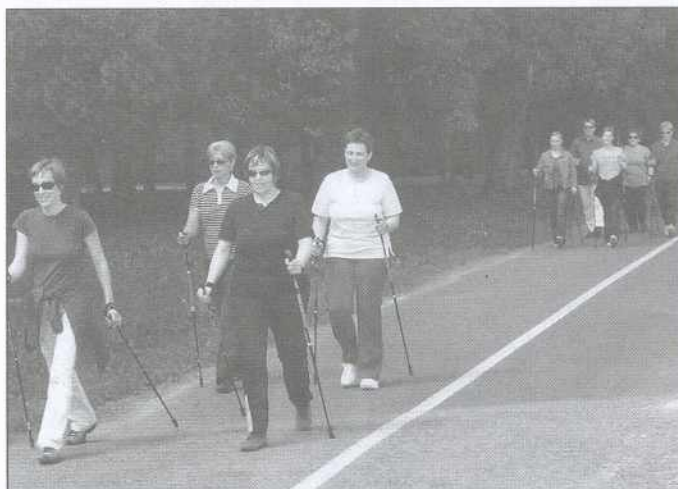
Gibanje je tudi večini Pomurcev način življenja.

Več deset pohodnikov se je po startu na notranjem parkirišču podalo do športnega letališča Rakičan. Poleg zaposlenih v bolnišnici so na pohodu sodelovale tudi različne nacionalne in lokalne organizacije, ki s svojimi aktivnostmi spodbujajo zdrav način življenja.