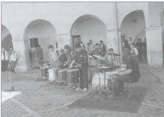
Mladi bobnarji so predstavili svoje znanje ob otvoritvi novih mladinskih prostorov v soboškem gradu.

V mreži multimedijskih centrov, imenovani M3C, deluje več centrov v Sloveniji. Partnerji multimedijskega centra KRIK so vse večje pomurske občine in razvojne ter kulturne institucije. Funkcija KRIK-a je spodbujanje inovativnih, kreativnih in drugih multimedijskih projektov ter idej, nudi pa bo pomembno funkcijo tehnične podpore drugim kulturnim organizacijam v regiji. Na skupnem multimedijskem portalu bodo združene kulturne aktivnosti v regiji, ki bodo preko vmesnikov povezane z nacionalnim kulturnim portalom. Tako bodo s pomočjo