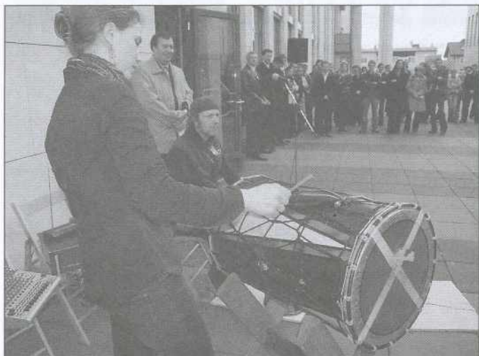
Skupina bobnarjev iz Maribora na otvoritvi.

N a je bila v Murški Soboti slavnostna otvoritev Zavoda PIP, ki brezplačne pravne storitve strankam nudi od 10. aprila naprej.