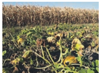
Suša terja vse večji davek.

Upokojenci so ne glede na višino pokojnine prejeli letni dodatek.