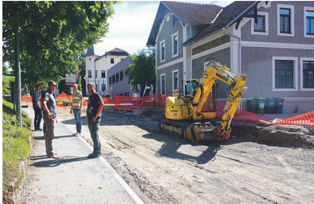
Obnovo Kajuhove ceste so načrtovali za poletje, ker je v tem času najmanj obremenjena.

Čeprav je Kajuhova v tem času najmanj obremenjena, pa se vsem težavam ne morejo izogniti. Vrtec Šoštanj, ki je v mestni prostor umeščen tik ob njej, je odprt tudi poleti, kar pomeni, da potrebujejo starši, ki dnevno vanj vozijo v varstvo otroke, do tja urejen dostop. V Vrtec pa prihajajo tudi občani, abonenti kosil. »Veliko usklajevanja in načrtovanja je potrebnega, da ne prihaja do težav, vseeno pa se vsem ni mogoče izogniti. Upam, da bo izvajalcem uspelo do novega šolskega leta cestno in drugo infrastrukturo dokončati do te mere, da promet oziroma dostop do