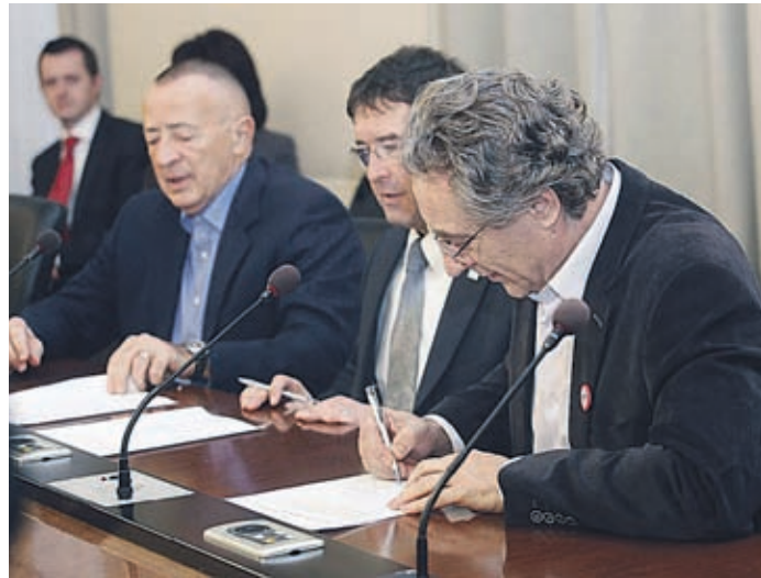
Predstavniki vlade in sindikatov javnega sektorja so podpisali anekse h kolektivnim pogodbam.

Predstavniki vlade in sindikatov javnega sektorja so podpisali anekse h kolektivnim pogodbam, s katerimi bo realiziran dogovor o odpravi dela plačnih nesorazmerij.