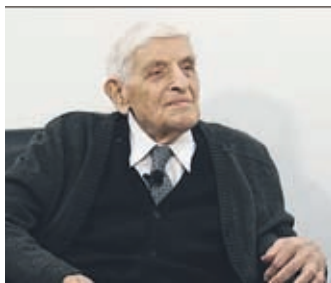
Umrli je priznani akademik Anton Vratuša.

V 103. letu starosti je umrl priznani akademik Anton Vratuša.