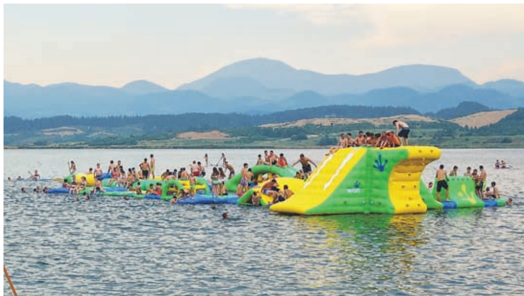
Vodni park je prava atrakcija za mlajše obiskovalce. Žal pa nanj v gneči zaradi varnosti ne spustijo vseh, ki bi si to želeli. Nadzor nad dogajanjem v vodnem parku opravljajo tudi s pedolinom.

vstopnimi in izstopnimi točkami za plovila? Prelovšek nam potrdi, da ga občina res še ni sprejela. »Vodno dovoljenje za štiri vstopno-izstopna mesta smo pridobili letos marc. Moramo se zavedati, da se še pred nekaj leti na Velenjskem jezeru ni dogajalo praktično nič. Brežine so bile zaraščene, jezero pa so uporabljali