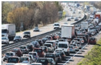
Na slovenskih cestah zaradi vrhunca sezone nastajajo zastoji.

Na slovenskih cestah zaradi četke počitnic v nekaterih nemških deželah in skorajšnjih kolektivnih počitnicah v Italiji nastajajo večji zastoji.