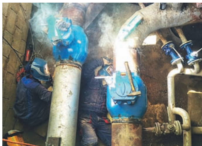
Remonti so vedno zahtevni, saj jih je treba opraviti v zelo tesnih jaskih, zelo kratkem času, letos pa še v peklenski vročini.

Kot smo dejali, so se trudili, da so bili intervali izklopov čim krajši. Najdaljši so bili izklopi v soboto v Topolšici (trajal je 16 ur), v petek na območju Podkrajja, ki je trajal 12 ur, prav toliko