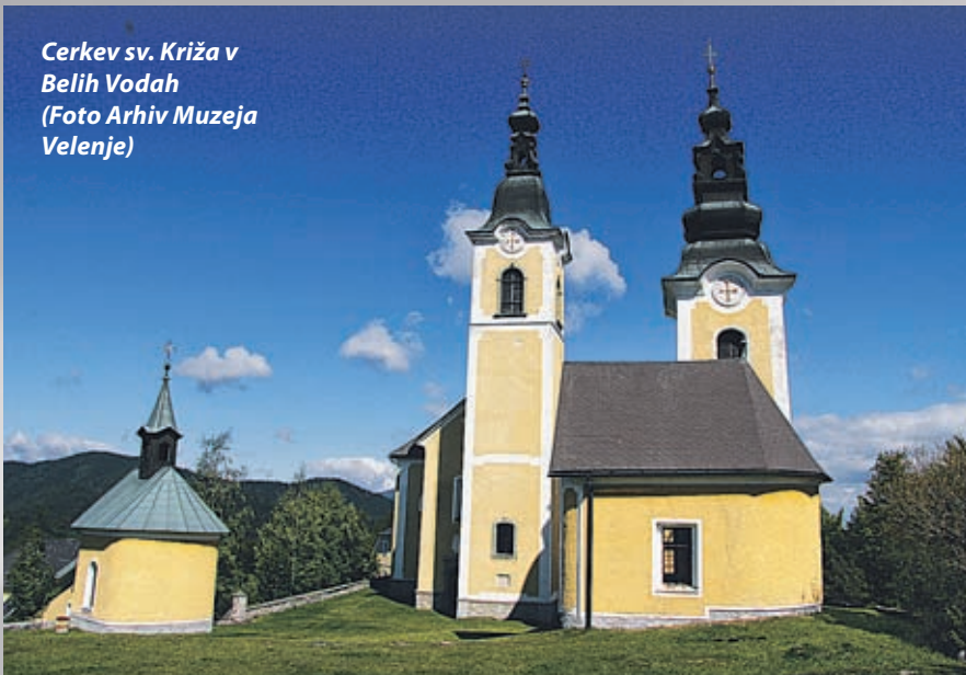
Cerkev sv. Križa v Belih Vodah