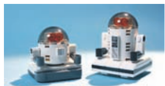
Umetna inteligenca je zlahka ušla iz nadzora.

Pri Facebooku so ustvarili robota, ki naj bi med seboj komunicirala in se pogajala. Eksperiment se je končal tako, da sta robota iznašla svoj jezik, ki ga njuni avtorji niso več razumeli. Zato so ju ugasnili.