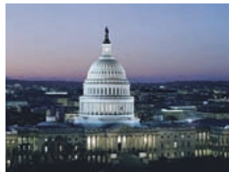
Ameriški kongres je izglasoval sankcije proti Rusiji.

Po predstavniskem domu ameriškega kongresa je predlog zakona o novih sankcijah proti Rusiji, Iranu in Severni Koreji potrdil še senat. Zakon med drugim predsedniku ZDA Trumpu prepoveduje rahljanje sankcij proti Rusiji brez dovoljenja kongresa.