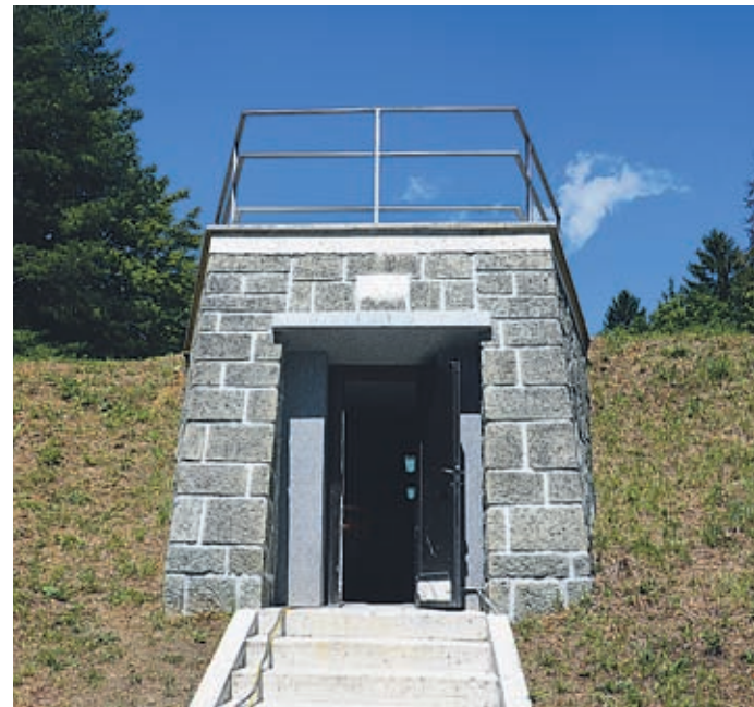
Od zunaj sploh ni videti, kaj vse je skrito pod zemljo. Notranjost vodohrana pa je v teh dneh gradbišča že takoj, ko stopimo skozi vhodna vrata, obdana s kamnito steno.

Naložba v obnovo vodohrana ne bo majhna. Ko bo končana, se bo številka ustavila pri 450 tisoč evrih, samo letos bodo za obnovo celice in dveh instalacijskih hodnikov odšteli 132 tisoč evrov. Obnovo financirajo vse tri občine, ki so solastnice Komunalnega podjetja Velenje. »Komunalno infrastrukturo imamo najeto od občin, zanjo plačujemo t. i. najemnino, ki je – grobo rečeno – enaka višini amortizacije. Iz teh sredstev občine financirajo obnovo naše infrastrukture. Jeseni se dogovorimo z občinami, kaj bomo obnavljali v prihodnjem letu, saj moramo upoštevati tudi tehnično-tehnološke zahteve vodovodnega sistema in interese občin.« Ko pride do naložbe, jo tudi skupaj nadzirajo, saj se tedensko srečujejo na sestankih.