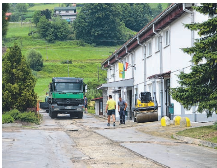
Ko v Vinski Gori gradijo nove komunalne vode, obnavljajo tudi ceste. Ob izgradnji kanalizacije v središču kraja so obnovili tudi cesto ob podružnični šoli in večnamenskem domu.

in območje Prelske,« še doda naš sogovornik. Tudi vodovodno omrežje še ni končano. Prihodnje leto pride na vrsto še Črnova, kdaj bodo z vodo opremlili redko poseljeni Petelinjek, pa še ni znano.