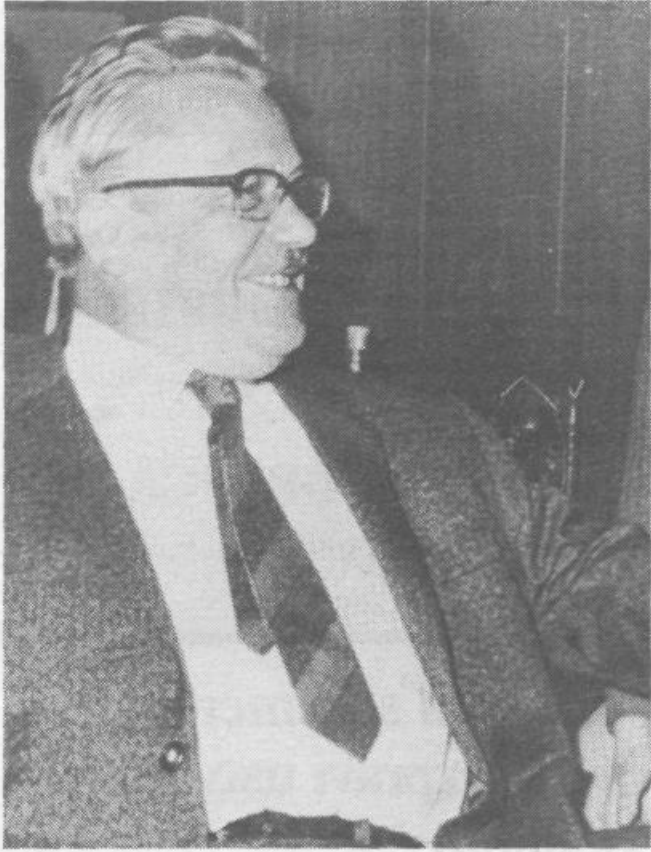
V spomin velikemu mislecu in revolucionarju EDVARDU KARDELJU