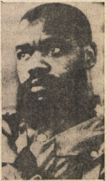
General Ojukvu, voditelj biafrskih secesionistov, je pobegnil v tujino

LAGOS, 12. — Tragedija v Biafri se bliža h koncu. V dveh letih in pol državljanske vojne je umrlo v Biafri od glada na milijone ljudi. Secesionisti so izgubili že vse glavne postojanke, mesta in letališča in še manjše skupine se posamezno upirajo v gozdovih kamor so se umaknile. Tako poročajo vesti, ki prihajajo tako iz Lagosa kot iz raznih evropskih mest. V Lagosu so danes sporočili, da tri nigerijske divizije napredujejo na vseh frontah, in se borijo proti ostankom biafrske vojske. Poveljstvo nigerijske vojske pravi, da je to poslednji napad za zadušitev biafrskega odpora, ki se je začel pred dvema letoma in pol. Časniki v Lagosu so danes objavili vesti o uspehih zveznih oboroženih sil. Lagoški «Daily Times» poziva nigerijske oborožene sile, naj ne popustijo, dokler ne bo vzpostavljena oblast zvezne vlade na zadnjem kosku biafrskega ozemlja. Kot poročata Ansa in AFP, iz nekega kraja v Biafri, sta se danes zjutraj dve biafrski diviziji upirali zveznim nigerijskim četam in sta še vedno nadzorovali letališče Uli.