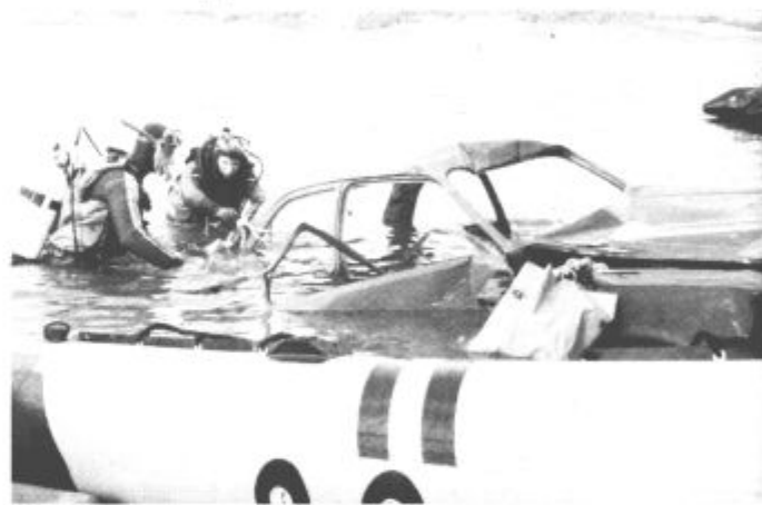
Če se stvari lotijo strokovnjaki, je tudi vozilo hitro na suhem.

Vajo so načrtovali že v začetku z leta, izpeljali pa so jo zadnji dan avgusta. "Ker se Velenje in njegova okolica z jezera, vse bolj