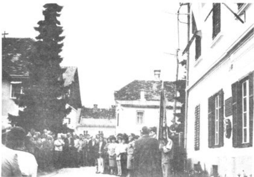
Pred Goričarjevo hišo v Mozirju se je zbralo veliko planincev ingostov