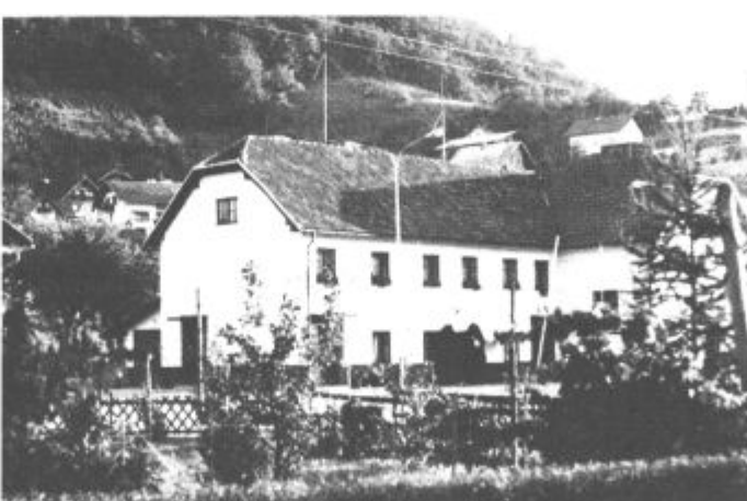
Poleg oskrbe s pitno vodo je v ospredju prizadevanj krajanov tudi ureditev lastništva doma krajanov

V začetku leta ni bilo prav nikakršnega upanja, da bi lahko uredili že večkrat v samoprispevku zapisano cesto Šaleška magistrala - Križnik. Volja, zagnanost in prizadevnost nekaterih posameznikov se je tudi tu obrestovala. Trkali niso zaman na vrata Termoelektrom Šoštanj, tudi sami so odvezali mošnjčke, da prostovoljnega dela ne omenjamo posebej. Dober teden dni je šele od minilo odkar Lokovico povezuje s Šoštanjem 700 m dolg asfaltiran odsek. Velika želja krajanov je, da bi ta postal lokalna cesta, in da bi skrb za njeno vzdrževanje prevzelo komunalno podjetje. Ob tej cesti so posodobili še cesto proti Hudalesu. 600 m 3 metrov gramoz (kot na cesto Šaleška magistrala - Križnik) tukaj sicer ni bilo potrebnih, brez udarniškega dela pa kljub temu ni šlo. Ko bodo uredili lastništvo, bodo krajan poskusili, da bi jo še asfaltirali. Morda prihodnje leto. "Lahko smo z zadovoljni. Še bolj pa bi bili, če bi v doglednem času uresničili še druge potrebe. Lani zgrajeni vodovod Križnik-Penk že ne pokriva vseh potreb.