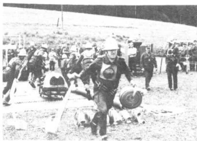
V tekmovalni zagrizenosti so nekatere ekipe napravile tudi kakšno napako, ki pa niso vplivale na sklepno ugotovitev, da so gasilci mozirske občine dobro usposobljeni in pripravljeni