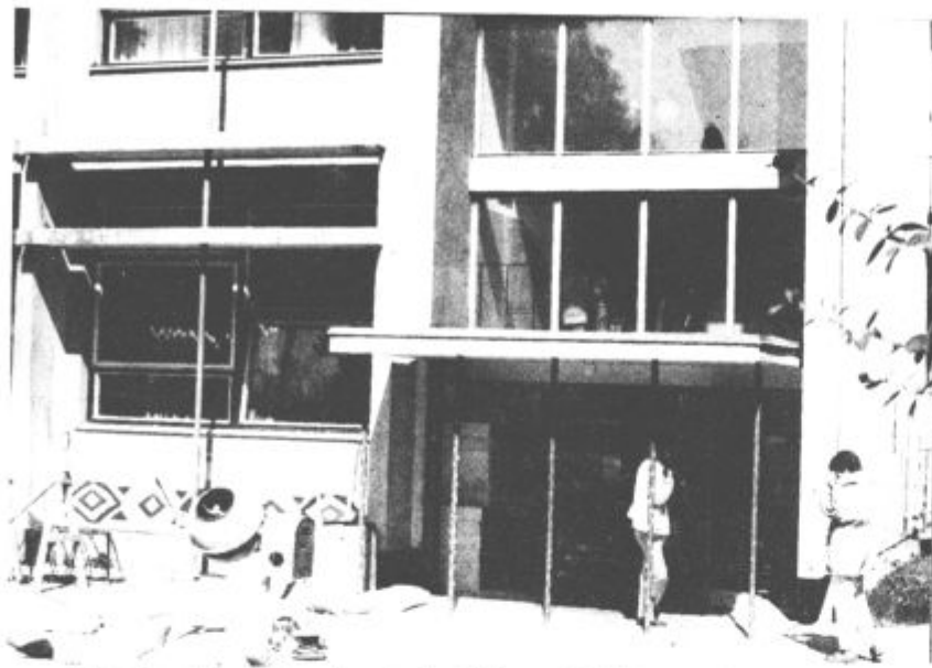
Dela pri nadzidavi gimnazije se bodo lotili v naslednjih dneh. Kljub prizadevanjem te naložbe ni bilo mogoče narediti prej.

učilnic in tri kabinete, žal, pa te pridobitve prostorske stiske ne bodo rešile. Le omilile, kajti "Gimnazijo so zgradili pred 20 leti z osmimi učilnicami in za 200 učencev. Vse, kar je danes več, smo pridobili s podiranjem sten, "žrtvovanjem" kabinetov za pouk. Za nameček pa se to šolsko leto izobražuje v gimnazijskem programu za 21 oddelkov otrok. Dolgoročno rešitev tega vprašanja je le nova zgradba." Tej naložbi v prid govore dejstva. Med njimi kakovost vzgojno - izobraževalnega dela. Ta se je letos pokazala pri uspešnosti velenjskih gimnazijcev na raznih tekmovanjih in na sprejemnih izpiti za višje in visoke šole. Za več kot 12 tisoč mest za bruce je bilo skoraj 17 tisoč kandidatov. Med 5 tisoč neuspešnimi menda ni nobenega velenjskega gimnazijca.