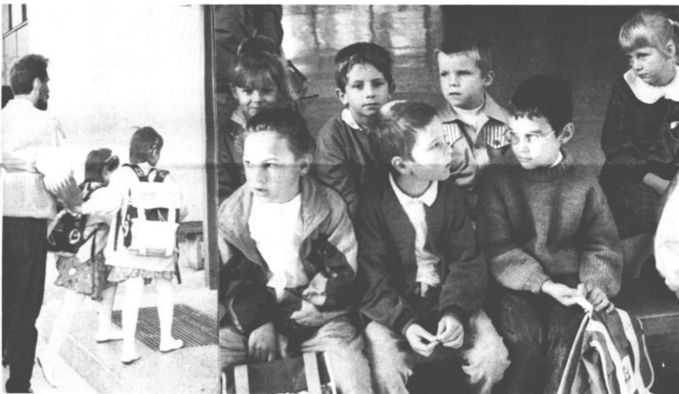
Veliko mejnikov nas pelje skozi življenje. Brez njih bi bilo verjetno puščeno. Eden njih je tudi prvi šolski dan v "ta pravil" šoli. Na vseh osnovnih šolah so včeraj prvošolčke pričakali s pozdravom in vzpodbudnimi besedami. Sedaj so tudi oni že čisto pravi šolarji in to bodo ostali še dolgo... ■ foto vos

In so se iztekli. Počitnice, seveda. Z včerajšnjim dnevem je Velenje spet oživel. Ceste so polne otrok in mladine, center mesta je med odmor, pred in po šoli, spet živahen, prav tako pa je tudi v drugih mestih in vaseh v občini.