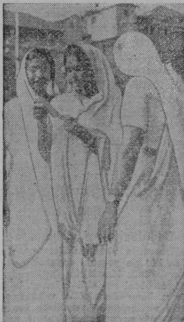
Voditeljice ženskega gibanja v Indiji razpravljajo na ulici pred zborovanjem