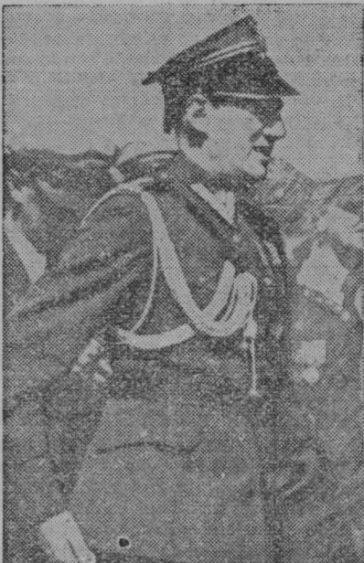
Poljski zunanji minister Beck v informalni topničarskega polkovnika