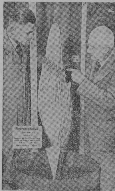
Nemški naravoslovec je prinesel iz pragozdov otoka Sumatra pod Indijo orjaško rastlino v Berlin. Rastlina je v Berlinu koj razcvetela. Listi te rastline zrastejo v dvakratni velikosti človeka