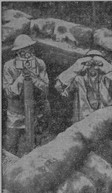
Pri zadnjih velikih zračnih manevrih na Angleškem so določevali s pomočjo fotografičnih aparatov, v koliko je zmogala ena letalska skupina nad drugo

Sv. Ana v Slov. goricah. Prostovoljna gasilska četa bo priredila v nedeljo, 10. septembra, velik gasilski praznik, združen s proslavo 20 letnice osvobodjenja. Ob tej priliki bo položen temeljni kamen za novi gasilski dom. Prireditve bo celodnevna s sledečim sporedom: 1. na predvečer kresovi; 2. v nedeljo ob 5 budnica po trgu; 3. ob 8.30 sprejem gostov; 4. ob 9.30 odhod k sv. maši, ki se bo darovala za rajne gasilce; 5. ob 11 slovesna blagoslovitev in položitev temeljnega kamna za novi gasilski dom; 6. slavnostni govori