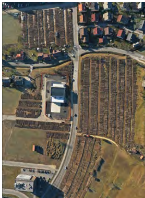
Slika 2: Pogled iz zraka