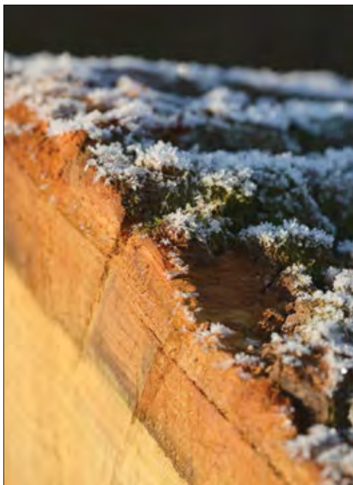
Slika 1: Les je lep

Gorski javor z najvišjo ceno za kubični meter je kupec odpeljal v Italijo. Drevo je zraslo v oko-