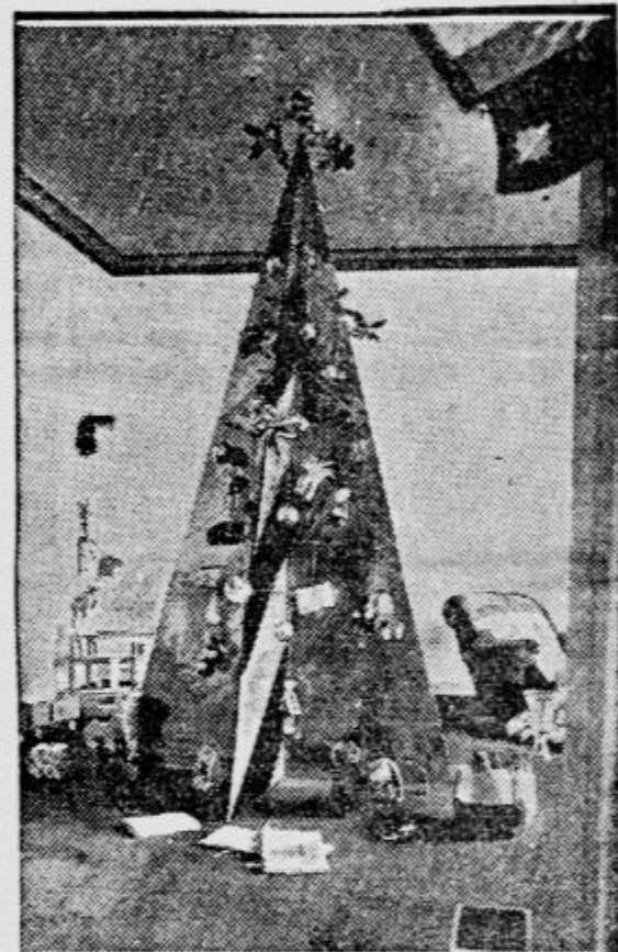
Okrašena smreka, kakor zahteva okus našega časa