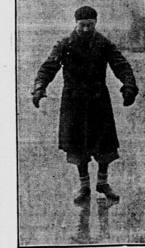
Pri Nogentu pokriva Marno tako debela ledna skorja, da se ljudje po nji drsajo in prenašajo čez zamrznjeno reko čolna