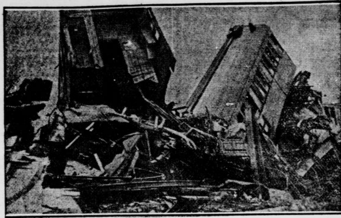
Vladukt pri Valencijsi na Španskem po bombnem atentatu, ki ga je razdejal. Pri eksploziji je bilo ubitih tudi več ljudi