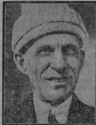
Amerikanski avtomobilski kralj Henry Ford, ki je star 68 let, je življensko nevarno obolel.