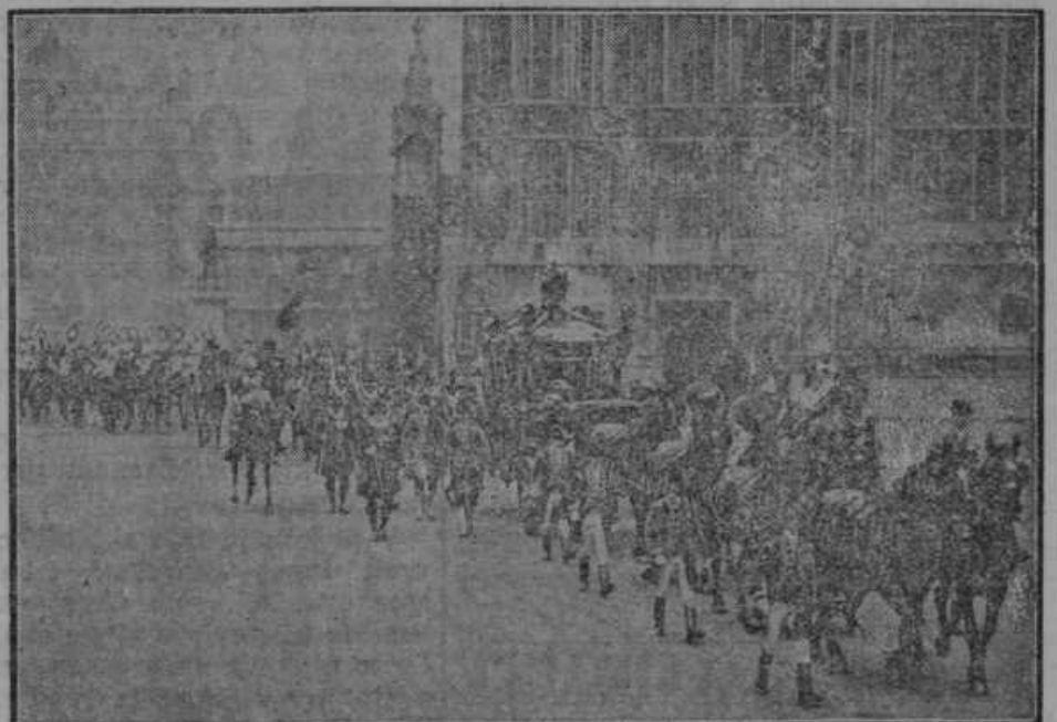
Odkritje spomenika znamenitega francoskega državnika Clemenceauja v Parizu. — Desno: Slovesna otvoritev parlamenta v Londonu, h kateri se pelje kraljevi par v kočiji.