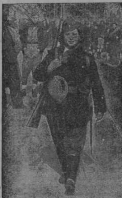
Spanska rdeča milličnica.