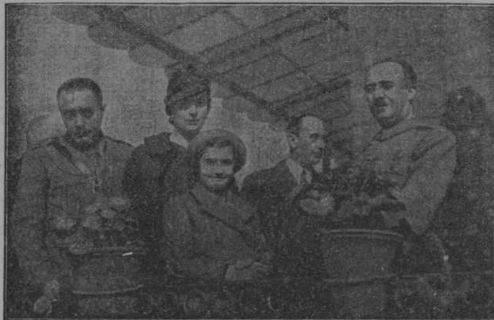
Vrhovni poveljnik španskih nacionalnih čet s svojo družino.