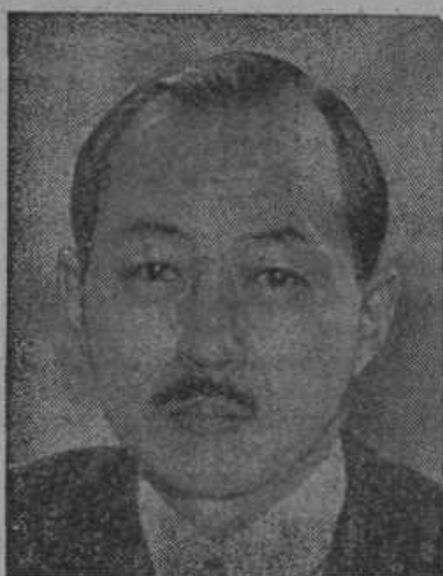
Sato, novi japonski zunanji minister.

Vlomilec opleni župnijsko pisarno. V Spitaliču pri Konjicah je izrabil neznanec službo božjo za vlom v župnišče. Vdril je skozi zaklenjeni glavni vhod in prišel skozi štiri sobe v župnikovo pisarno. Odnesel je 8000 Din gotovine, več hranilnih knjižic in nekatere listine. Ukradeni denar je obstojal iz raznih zbirk in pred-