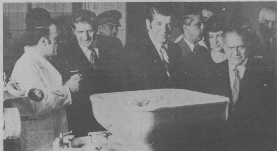
INDIJSKI PREDSEDNIK V ŽITU — Prve dni oktobra je bil na uradnem in prijateljskem obisku v naši državi predsednik republike Indije Fahrudin Ali Ahmed. 2. oktobra popoldne se je s svojim spremstvom ustavil tudi v kombinatu Žito. Oglel si je obrate na Šmartinski 154. Gostom smo ob enotnem obisku pripravili tudi razstavo in degustacijo naših izdelkov.

O sprejetih zaključkih skupščine so člani občinskega sveta (Nadaljevanje na 2. strani)