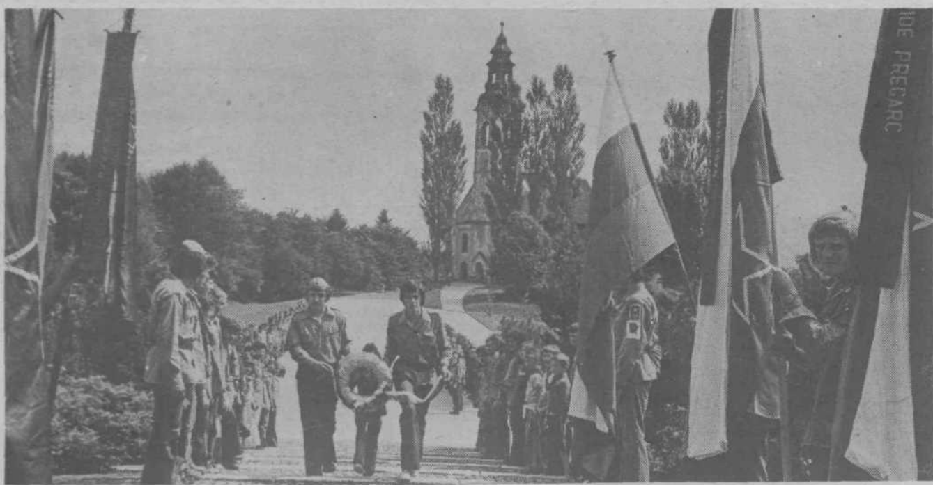
... preteklost nas usmerja v sedanost in nam daje resnično voljo, da spominjamo tradicije v mobilizirano moč, ki povezuje starejše in mlajše v boju za razvoj naše socialistične samoupravne družbe ...

Odbor vljudno vabi vse svoje člane oziroma občane, da se žalne slovesnosti udeležijo v čimvečjem številu.