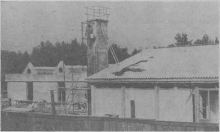
Na osnovni šoli Novo Polje so dela zaključena