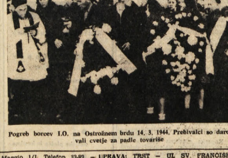
Pogreb borcev I.O. na Ostrožnem brdu 14. 3. 1944. Prebivalci so darovali cvetje za padle tovariške