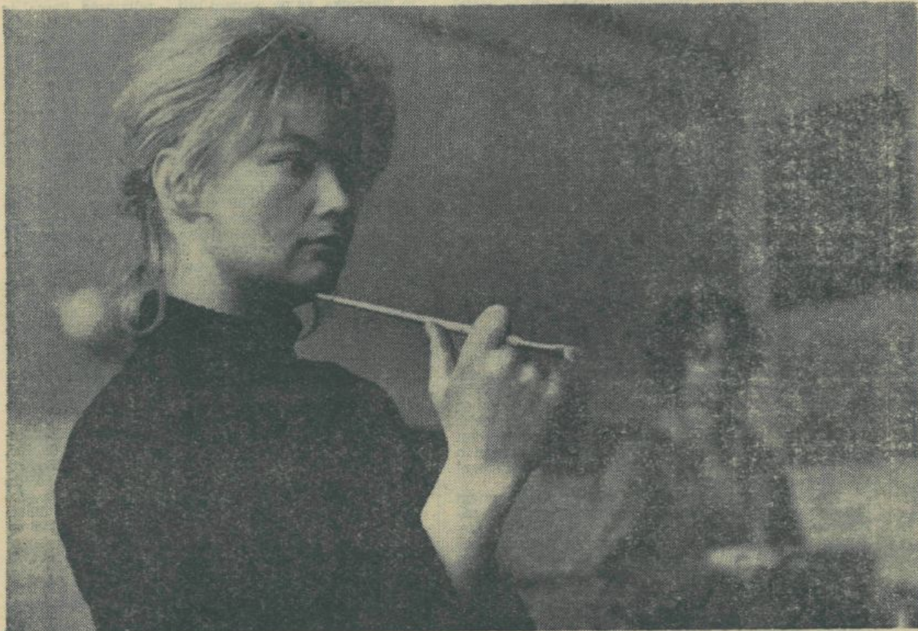
V ateljeju, foto Zmago Jeraj