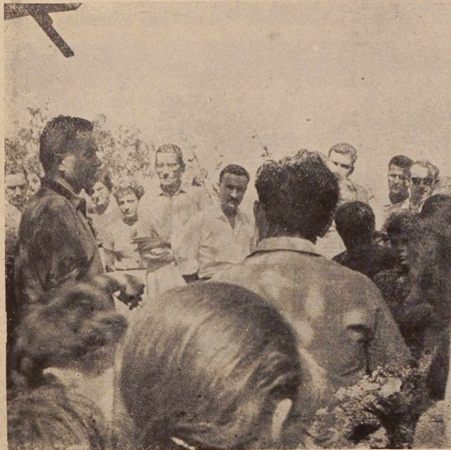
S sobotne svečanosti v lendavskih gorica