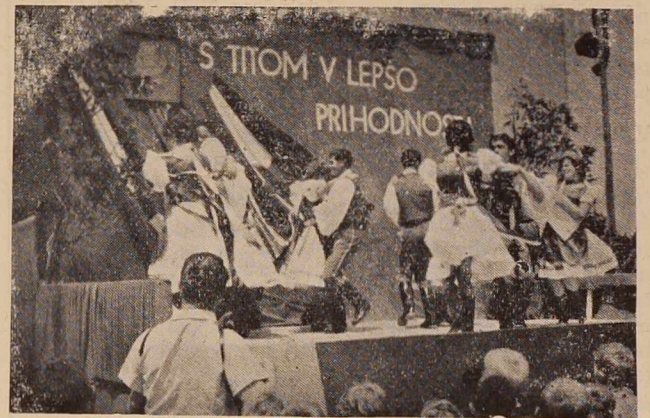
Madžarska folklorna skupina iz Lendave nastopa na zaključni proslavi občinskega praznika v Crensovcih

tov. Vido Tomšičevo, dosedanjega predsednika republiške skupščine.