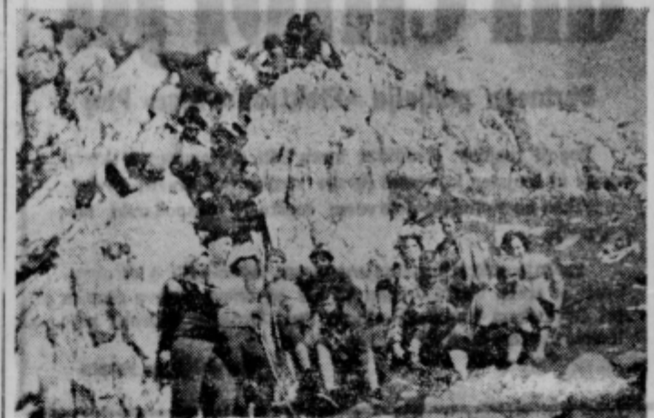
Ptujski planinci na Peci

Lep primer človeških ribic najdemo tudi v Skočjanski jami pri Divači. Pojedine ribice so dolge do 30 centimetrov in so po vsej verjetnosti tudi najdaljše, ki so jih doslej našli v našem podzemlju.