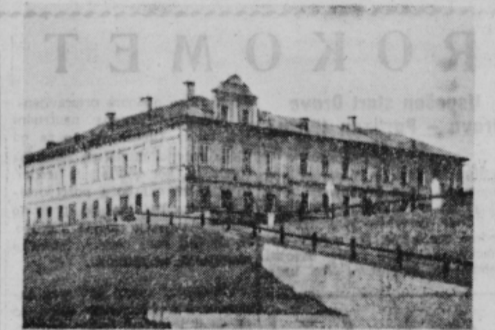
Celovec: Dijaški dom slovenske prosvetne zveze

je Slovenski vestnik s svojo tehtno besedo, ko je pripovedoval o življenju in delu naših bratov in sester na Koroškem, naglašal želje in misli naših naprednih ljudi na Koroškem. Boril se je za gospodarsko in kulturno enakopravnost Slovencev v Avstriji, zavzemal se je za mir, demokracijo, svobodo in blaginjo Slovencev in vsega človeštva.