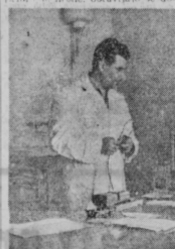
Zdravniški pregled v ZD Ptuj

znani. Posebno so izpostavljeni neizgode novinci, prej kmečki delavci, ki jih vključuje v tovarniško delo pospešena industrializacija zemlje. Ti nimajo delavskih izkušenj. Ne morejo se naenkrat prilagoditi hitrosti in natančnosti dela stroja. Dodatno so še obremenjeni z neurejenimi življenjskimi pogoji: stanujejo dačč, vsakodnevno potujejo, nimajo primerno hrane, obravljajo še do-