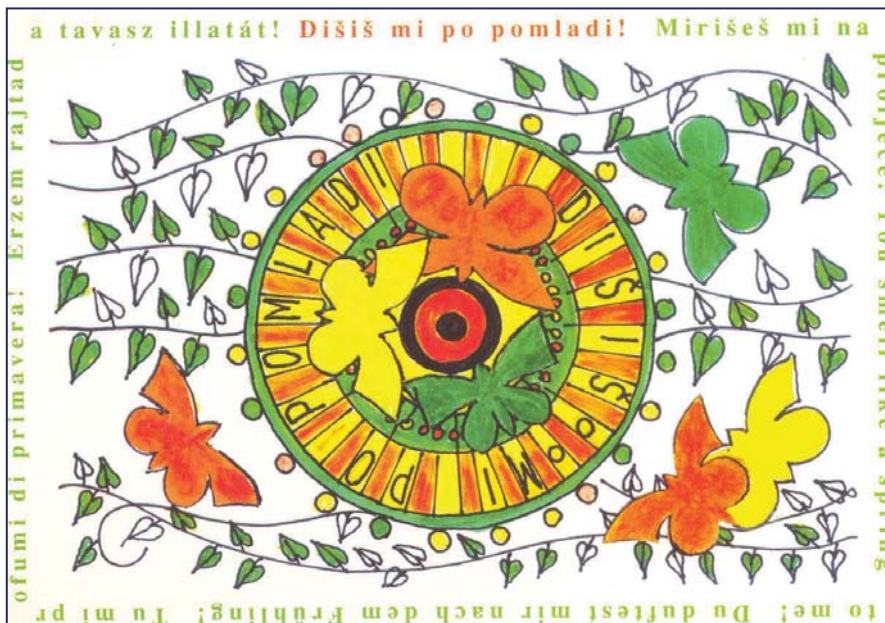
Slika 1. Kartica Felix: Dišiš mi po pomladi

V teku šolskega leta učenci pod vodstvom mentorja izvajajo aktivnosti programa Vzgoja za nekajenje in natečaja. Zaključek vseh aktivnosti je na končni regijski prireditvi z naslovom Dišiš mi po pomladi v maju. Prireditev je obogatena z razstavo izdelkov šolarjev (Slika 2).