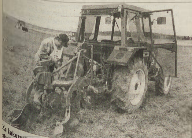
Za kakovostno brazdo je potreben kakovosten in sevda ustrezno naravnani plug.