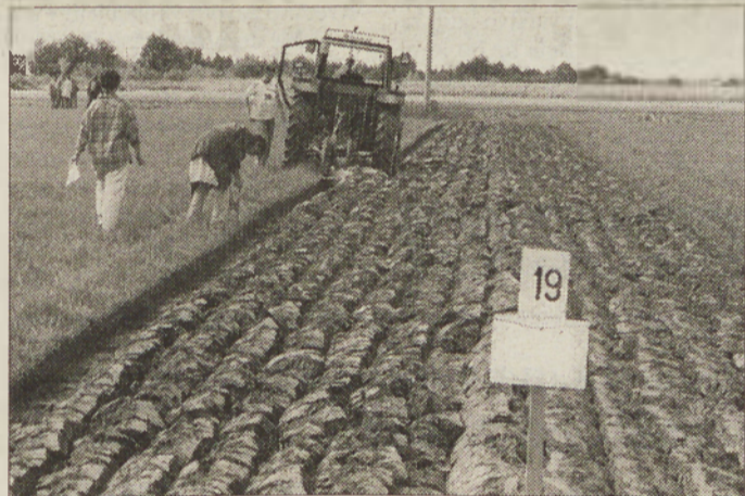
Brazde morajo biti enakomerno položene in izenačene, pomembna pa je tudi globina oranja.

pripeljati do konca. V prijetnem vremenu se je za naslove najboljših slovenskih oračev na ledini potegovalo 24 tekmovalcev, poleg dvočlanskih ekip iz desetih slovenskih regij je namreč sodelo-