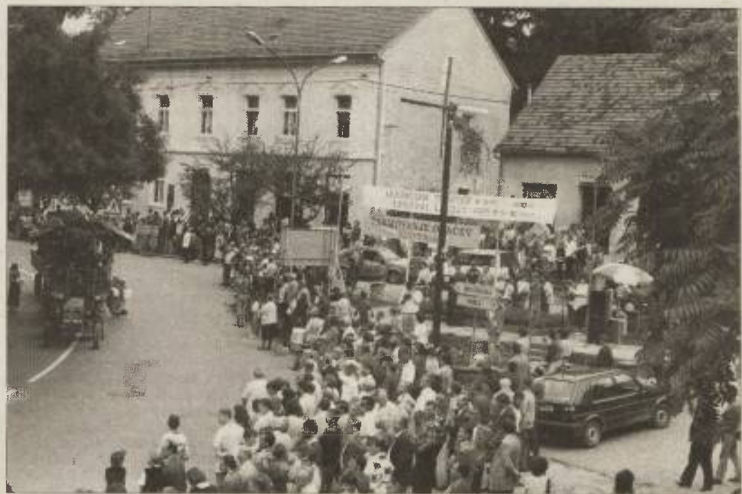
Lendavska gostinsko-turistična prireditev Lendavska trgatav je kot že vrsto let doslej obudila spomine na nekdanja vinogradniška opravila in običaje. Te so prikazala kulturno-umetniška društva iz lendavske in drugih občin. Na prireditvi so se predstavile tudi folklorne skupine iz Slovenije, Mad-

žarske in Slovaške. Prireditev je pritegnila nekaj tisoč obiskovalcev. V Lendavi so ob tej priložnosti proslavili tudi 50. obletnico delovanja šahovskega društva, v nekdanji dvorani Nafta so pripravili prikaz rokodelci iz Madžarske, oraci pa so se pomerili na državnem prvenstvu. Jani