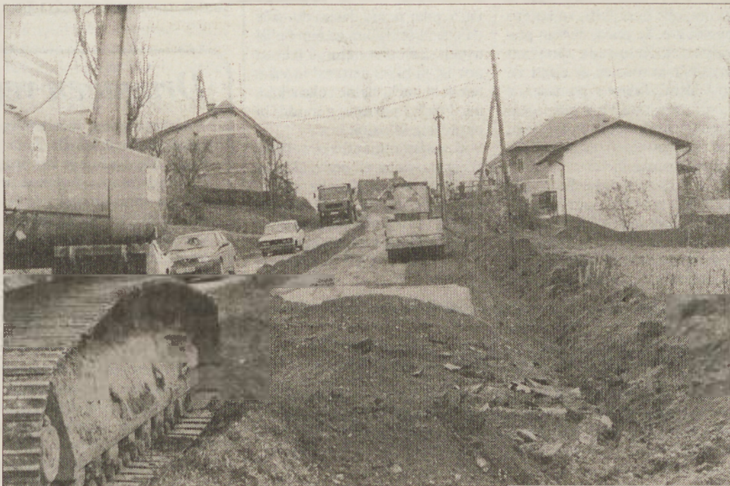
BREZ BOLJŠIH CEST NE BO ŠLO - Tega se dobro zavedajo tudi snovalci raziskovalne naloge o Goričkem, kjer bo treba urediti še marsikatero prometno povezavo.

Kot ugotavljajo, je zemlja na tem delu Goričkega zelo različna, prevladuje pa težka, ilovnata prst. Povezava z Mursko Soboto in drugimi večjimi središči Goričkega je zadovoljiva, saj omogoča ustrezen prevoz pridelkov, hitro dostavo in v zadnjem času tudi dober dostop do večjega dela kmetij na Goričkem. Pri tem je zahodni del Goričkega pod vplivom naprednega kmetovanja v sosednji Avstriji (sadjarstvo), zato novejša tehnološke pridobitve že uvajajo v sadjarstvo in vinogradništvo. Dovolj je tudi mehanizacije. Poleg tega je Goričko odmaknjeno od večjih onesnaževalcev zraka in večjih prometnih povezav. Tam je večja površina mešanih gozdov, ki vplivajo na čistost zraka in prijetnost gibanja. Izračunali so, da je na tem območju 14.900 hektarjev in vrtov, 10.120 hektarjev travnikov in pašnikov, 500 hektarjev ekstenzivnih in 600 hektarjev intenzivnih sadjarstev ter 15.000 hektarjev gozdov.