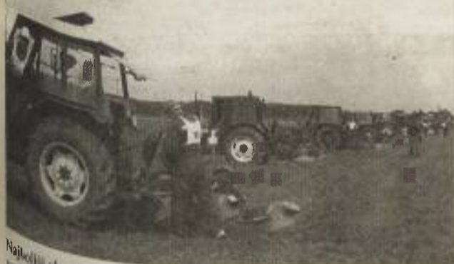
Najboljši slovenski orači pred startom. Le še sodniški znak in tekmovalci se bodo začelo.