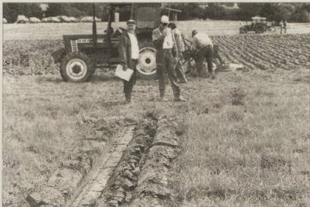
Odpiranje prvih brazd se ocenjuje posebej.

vič in Anton Geder, enkrat pa je na tem največjem svetovnem tekmovanju sodelovala tudi Blanka Bukvič. Čeprav je prvi dan tekmovanja orače oviralo vreme in niso mogli končati oranja na strnišču, je organizatorjem tekmovanja v soboto vendarle uspelo