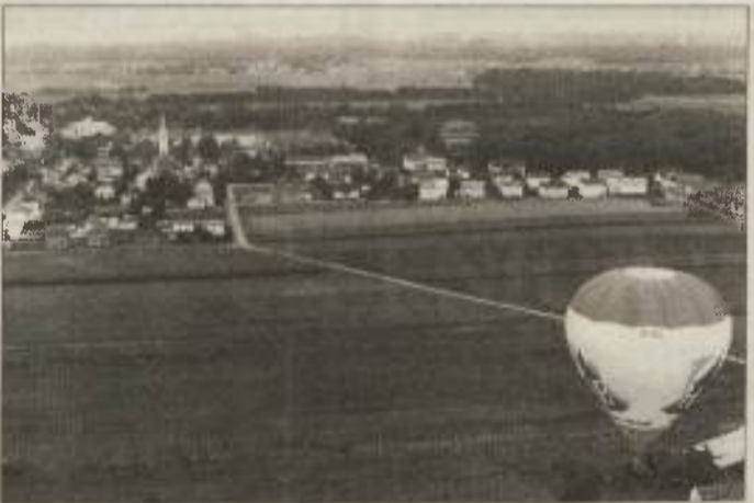
Pogled z »balonarske perspektive« na druga dva balona in Moravske Toplice

Povabili so se odzvali balonarji iz Ljubljane, Maribora, Murske Sobotice, ki so se zbalonirali v petek, ko so popeljali v višave novinarje in se nekateri druge goste. Nekateri so lahko prišli na svoj predstavnik pokroviteljev Moravskih Toplic, obenem pa se je z enega od balonov oglašala ekipa Murskega balonarskega društva, ki je sodelovala na balonarsko tekmovanje, in ki je poletel prvi, morali »lo-« vsi drugi, se mu torej naj-