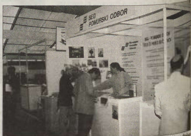
Pogled na stojnico pomurskega odbora SEG-a, kjer so zbirali podpise proti jedrskim poskusom.

čevali v regionalno planersko delavnico Pomurje - Prlekija, v projekt Razvojna strategija Pomurja, bdeli bodo nad stanjem kakovosti površinskih voda in po-