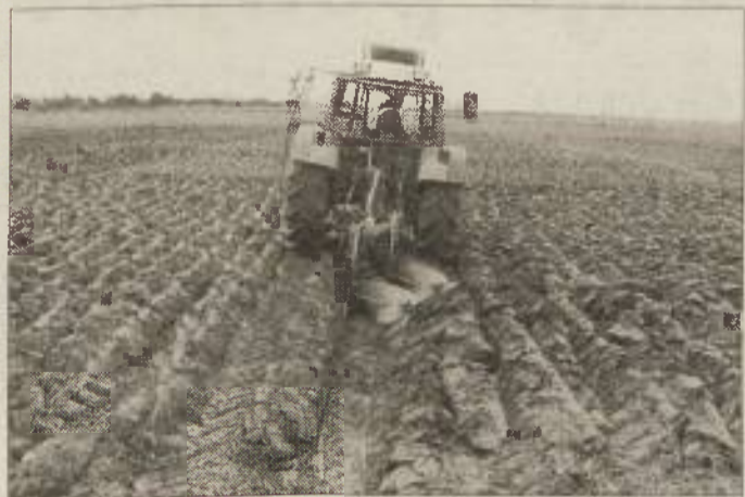
Potrebno je paziti tudi na naleglost in izenačenost zadnjih brazd ter na globino in širino razora.