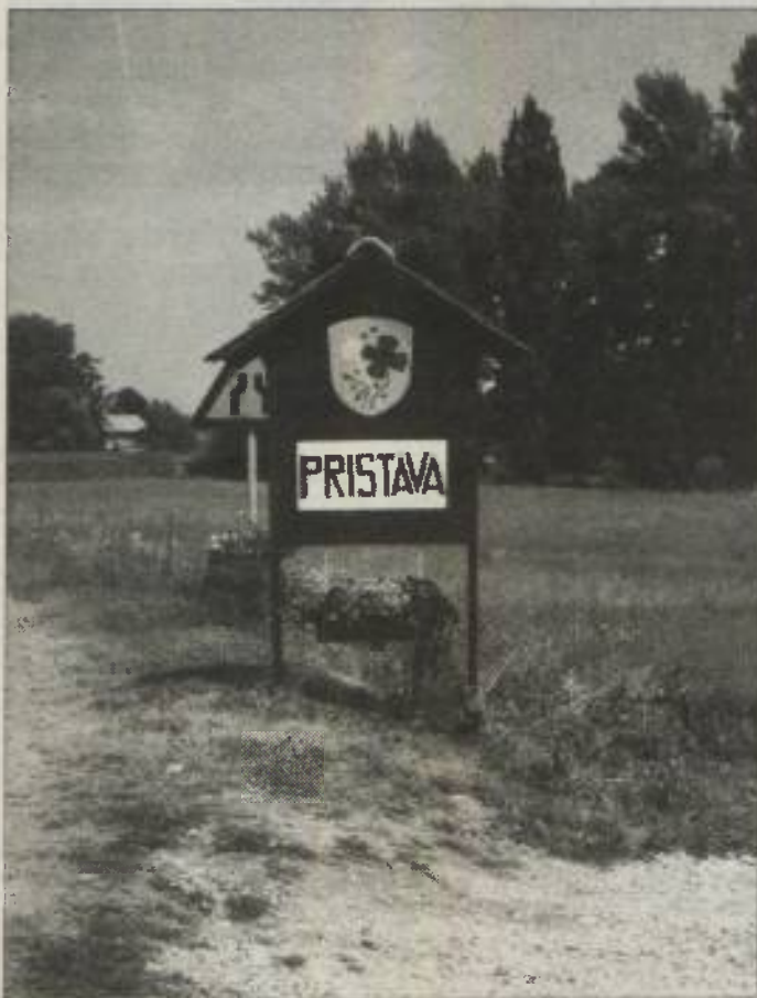
LEPO OZNAČEN KRAJ – Pred krajem Pristava v občini Ljutomer je oznaka na lepem panoju. To dokazuje, da se da z malo truda veliko narediti in bi lahko bilo za zgled tudi drugim!