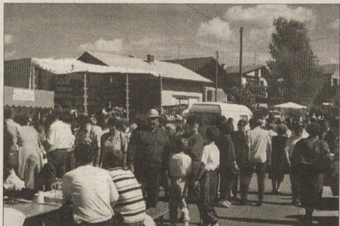
Potniki muzejskega vlaka in drugi obiskovalci na Kapeli.

dja, vina in drugih pridelkov. Pripravili so seveda tudi kulturno-zabavni program, v katerem so nastopili učenci OŠ Kapela in Ansambel Alfija Nipiča.