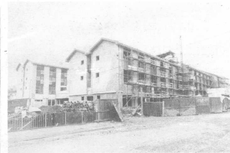
Zadnja gradbena dela na Domu za ostarele občane v Kozelji

Pripravili: IVO BREČIČ JANJA DOMITROVIČ STANE JESENOVEC