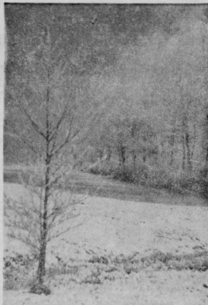
Se malo na snegu in potem zopet na trati