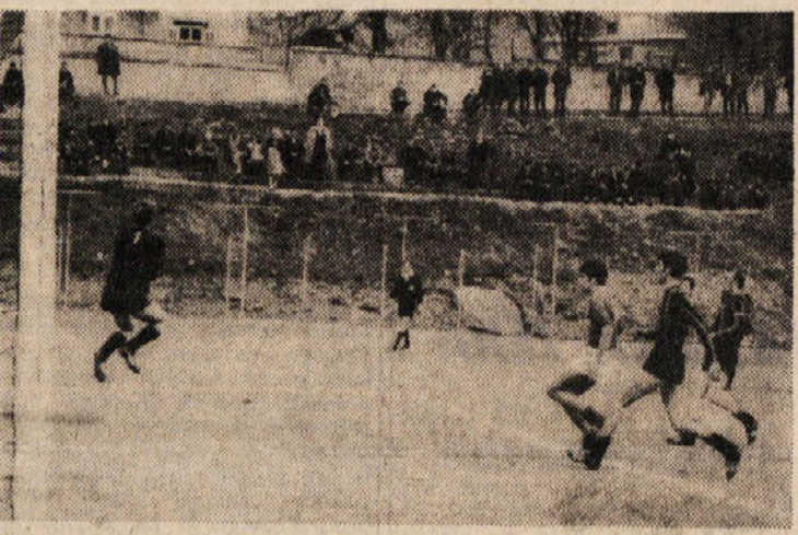
Zarja - Inter SS: vratar Interja je imel preteklo nedeljo precej dela z obrambo svojih vrat in vedno ni bil tako uspešen, kot je videti na našem posnetku