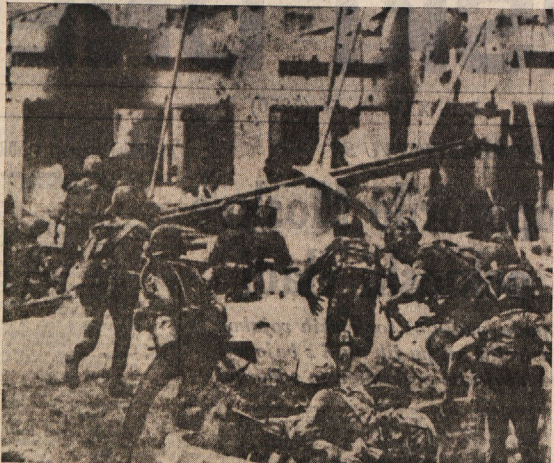
Sajgonski vojaki brezupno begajo po ulicah med raketnim napadom oddelkov južnovietnamske osvobodilne vojske

Neki častnik je nesel študentova funta (približno 3.000 lir) za sklad brucovanja in se vrnil na poveljstvo z atlantske zastave.