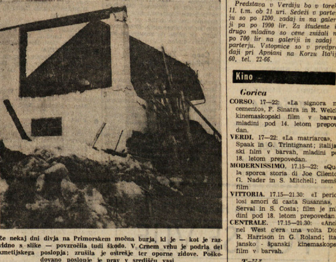
Ze nekaj dni divja na Primorskem močna burja, ki je — kot je razvidno s slike — povzročila tudi škodo. V Crnem vrhu je podrla del kmetijskega poslopja; zrušila je ostreže ter oprne zidove. Poškodovano poslopje je prav v središču vasi

Menični protesti V prvi polovici meseca februarja so na Goriškem prijavili 507 meničnih protestov. Največ jih je bilo v Gorici, in sicer 202. Sledijo: Trzin 124, Gradče 36, Ronke 32, Krmič 24, Gradiska 17, Starancan 15, Doberdob 8, Romani 8, Zagrag 8, San Pier ob Soči 7, Turjak 3, Marjan 3, Škocjan ob Soči 3, Kopriva 2, Dolenja 2, Fara 2, Foljan 2, Moša 2, Slovrenc 2, Vilese 1.