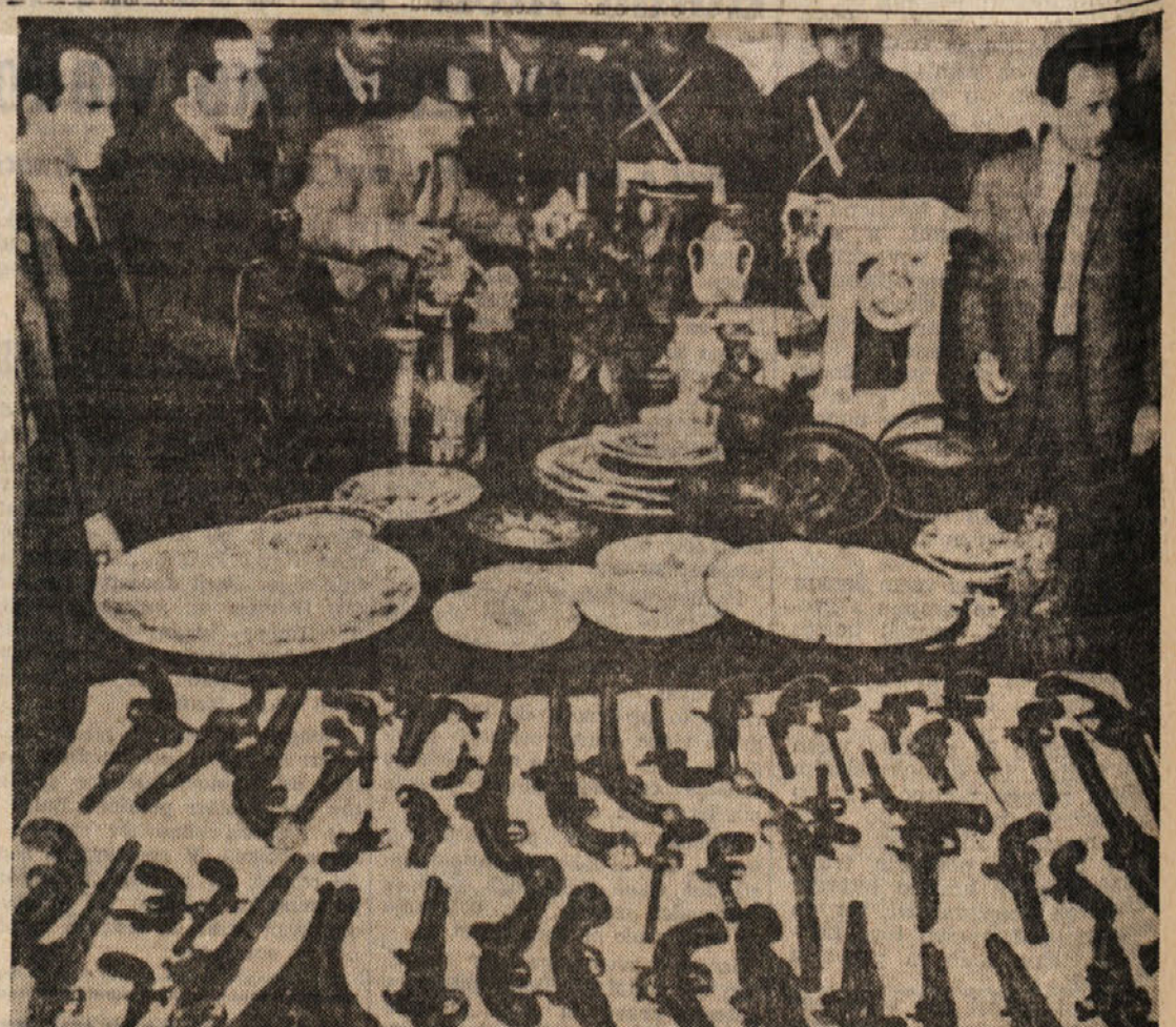
Starinski samokres in umetniški predmeti, ki jih je policija v Genovi zaplenila tolpi, ki je vlamljala v vile in gradove grofov