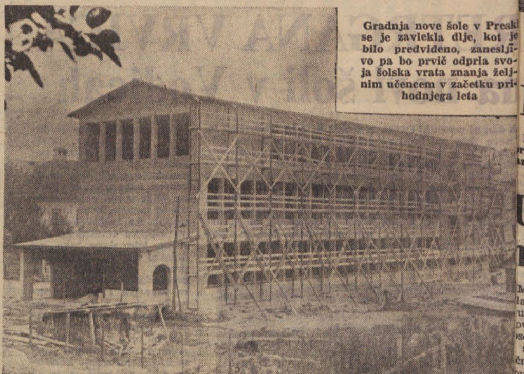
Gradnja nove šole v Preski se je zavlekla dlje, kot je bilo predvideno, zanesljivo pa bo prvič odprla svoja šolska vrata znanja željnim učencem v začetku prihodnjega leta

v Kranjski gori. Lani smo uredili kuhinjo in jedilnico s čimer smo močno vplivali na boljše počutje gostov, ki so s tem dobili tudi svoj družabni prostor. V glavni sezoni je bilo v Kranjski gori zasedenih približno 90 odstotkov zmogljivosti, medtem ko smo letos zabeležili tudi v predsezoni in po nje