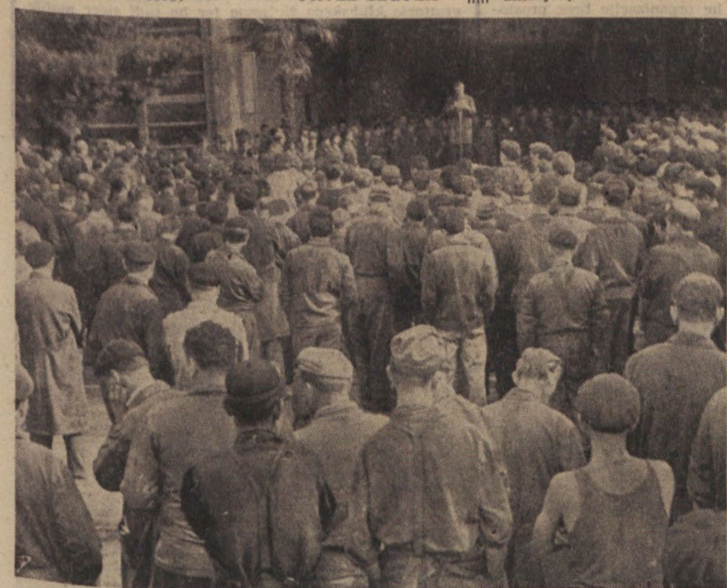
Litostrojski delavci so se zbrali, da se pogovore o plačilu ljudskega posojila za obnovo Skopja