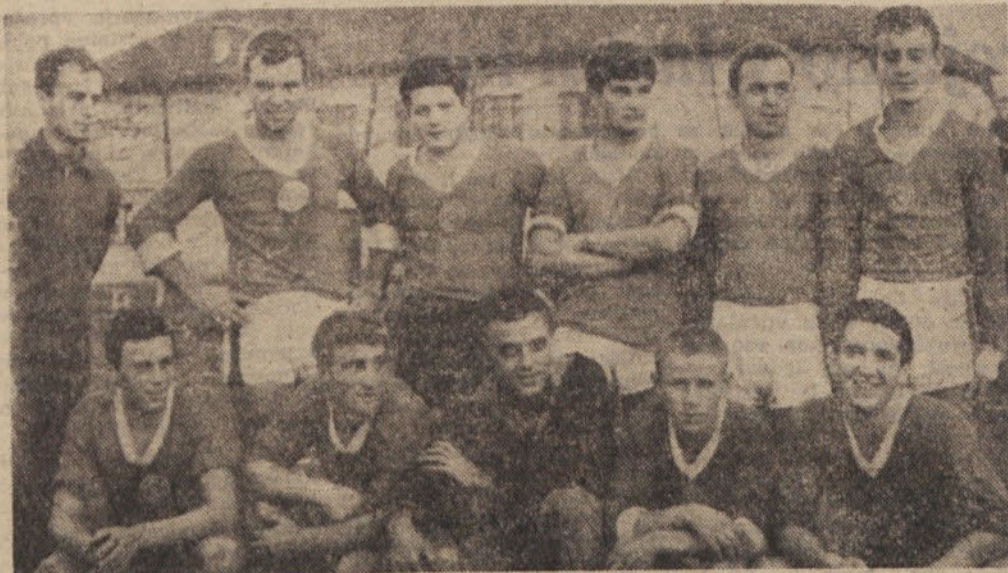
Ekipa rokometišev »TVD Partizan« — Medvode redno trenira in nastopa. Sestavljajo jo večinoma mladi igralci, ki zato še nimajo potrebnih tekmovalnih izkušenj. Na sliki: člani rokometne vrste TVD Partizan

Doslej je bila napetost tako slaba, da včasih ni dosegla niti 100 voltov.