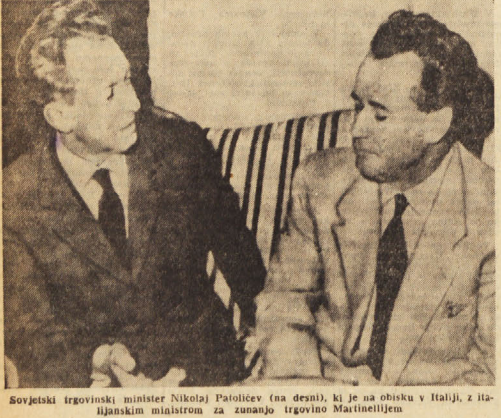
Sovjetski trgovinski minister Nikolaj Patolicev (na desni), ki je na obisku v Italiji, z italijanskim ministrom za zunanjo trgovino Martinelljem