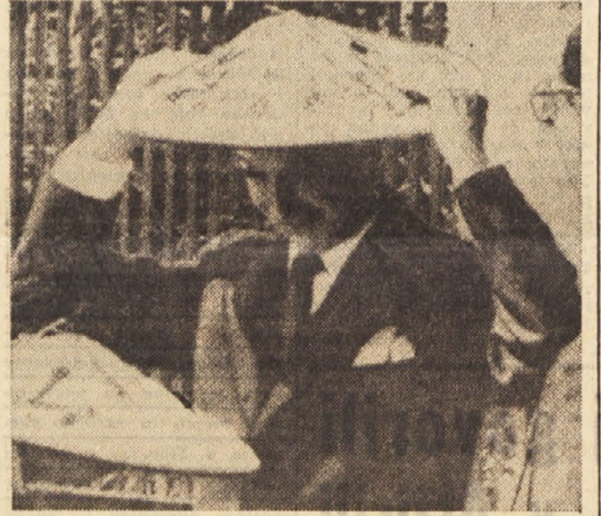
Ko je bil zunanji minister Segni na obisku na Japonskem. Je obiskal tudi nekaj karakterističnih trgovin. Fotograf ga je spritsilni, ko si natika značilno japonsko pokrivalo

Med preiskavo je državni tožilec zelo ostro napadel glavnega obtoženca, ki ga je označil kot enega najhujših zločincev in si zvrščevala ene najbolj sramotnih strani vse nemške zgodovine. »Prezrva nas čit groze, če pomislimo, da so bili vsi njegovi zločini izvršeni v imenu nemške vlade. Naj bi kazen, ki mu bo izrečena, služila vsaj kot opozorilo bodočim nemškim generacijam.«