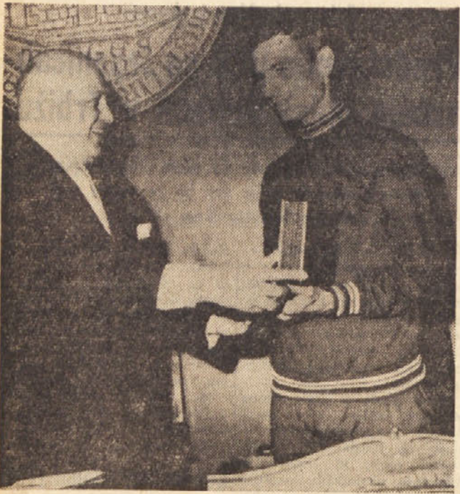
Svetovni prvak Rick Van Looy, ki je zmagal v Trstu, je včeraj dobil še eno nagrado: tržaški župan mu je izročil zlato kolajno s starim občinskim pečatom