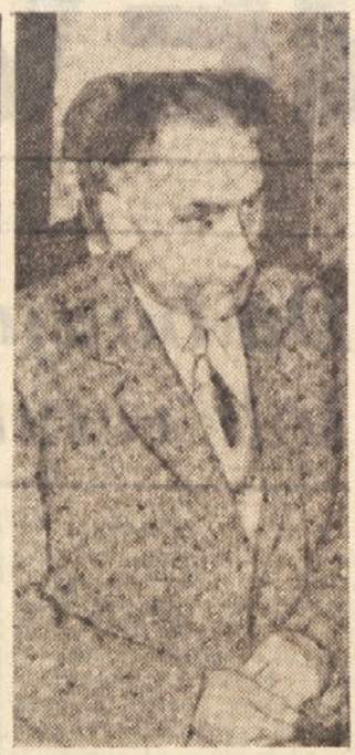
Richard Baer, zadnji poveljnik nacističnega uničevalnega taborišča v Auschwitzu, je bil v Frankfurtu zaslišan v zvezi s procesom proti Eichmannu. Baer se je dolgo časa skrival pod lažnim imenom, decembra meseca pa so ga aretirali. Na sliki ga vidimo, ko prihaja na sodišče.

Nadalje ugotavlja poročilo omenjenega odbora, da se je v letih 1958 in 1959 v zahodni Evropi močno okrepilo povpraševanje po trajnih potrošnih predmetih, zlasti po motornih vozilih, hladilnikih in pralnih strojih, medtem ko je precej popustila ekspanzija kapitalnih dobrin, kot so sredstev, ladiah, letalnih in pod. Povpraševanje po trajnih potrošnih pred-