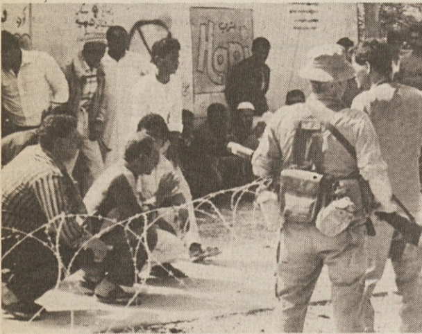
Palestinci pred davčnim uradom v Gazi, kjer morajo plačati pristojbine za delo v Izraelu

GAZA — Na zasedenih ozemljih je včerajšnji dan minil v znamenju splošne stavke trgovcev v znak solidarnosti s Palestinci, ki so jih pred nedavnim izraelske oblasti izgnale v Libanon. Toda povsod so bili tudi spopadi, izraelska vojska pa je ponekod proti demonstrantom uporabila tudi strelno orožje.