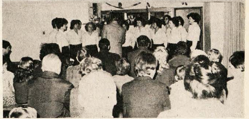
Ženski pevski zbor „Oton Zupančič“ iz štandroža