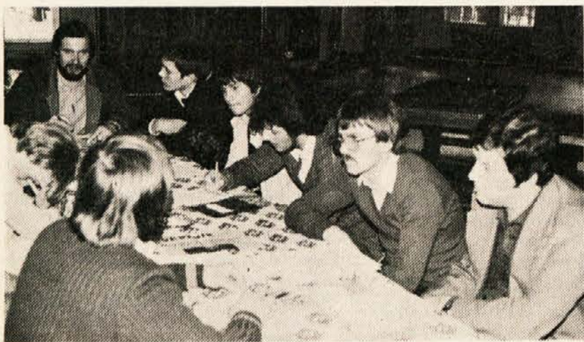
Na seminarju športnih delavcev in funkcionarjev v Planici