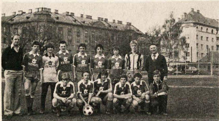
Mladinsko moštvo SAK v drosih, ki jih je poklonilo podjetje Topsport iz Pilberka