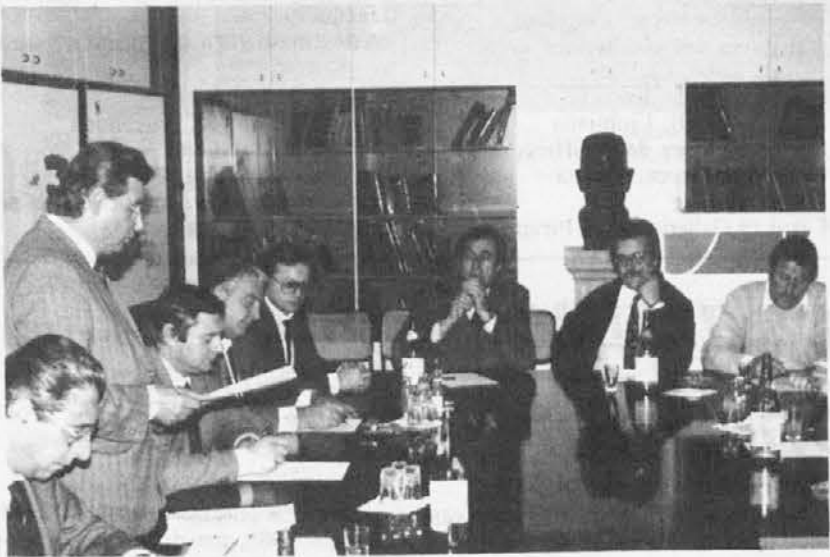
Pogled na dvorano k.d. Ivan Trinko med srečanjem s predsednikom Pokrajine in sodelavci prejšnje sredo