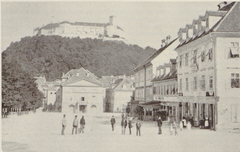
Staro Deželno gledališče v Ljubljani (pogorelo 1887)