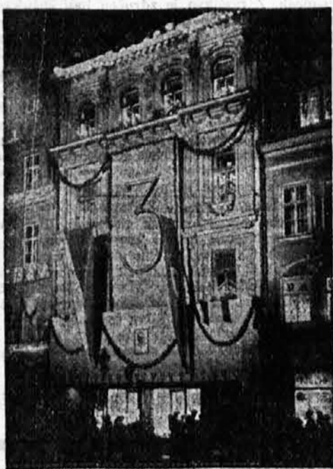
Okrasjen dom sudetsko nemške stranke v Reichenbergu, kjer je Henlein slovesno proslavil svojo zmago pri zadnjih volitvah. V zelen okvir so dejali veliko trojko — tretji rajh.

In res je to — bi rekli — nekaka skrbna gospodinja, ki mora skrbeti za vse in opraviti tudi vse najbolj neprijetne hišne posle. Od nje bi se