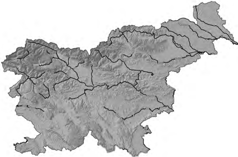
Slika 1: Popisni odseki januarskega štetja vodnih ptic (IWC) na rekah in obalnem morju v Sloveniji leta 2018; črne črte označujejo popisane, bele pa nepopisane odseke.