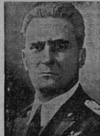
Vrhovni poveljnik italijanske vojske v severni Afriki maršal Graziani

Opozorjamo, da se s 1. februarjem spremeni tarifa za oglase!