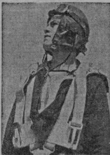
Obličina angleških letalcev