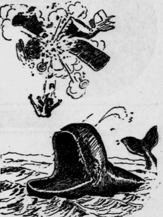
Išče se filmska igralka, ki bi predstavljala ta prizor.

Ubogi sodnik, ki je moral najti pravo od-ločitev med vsemi temi stališči in predlogi, je pripomnil, da je celo sam pisal svojo doktorsko disertacijo o vprašanju «pasje noči», a vendar ni stvar tako preprosta. Od-visna je namreč od psov, ne od ljudi. To so videli tudi advokati obeh strank, ki so sprejeli brez nadaljnega oklevanja ponude poravnavo. Nato so se zmenili, da se bo do sedaj sestali in se pomenili o uresnitvi tiste ideje o «pasji noči». Brčkone mislijo povabi-ti na pomenek tudi potsdamske pse, da bodo še ti zalajali kakšno pametno.