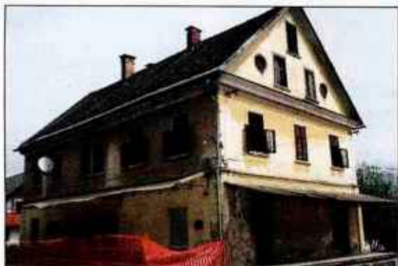
Podbrezje - nekdanja zadruga in trgovina, sedaj propadajoč objekt