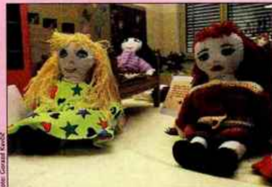
Za punčko iz cunj je bilo treba odšteti 17,11 evra, kolikor znaša cepljenje enega otroka proti šestim boleznim.

V letošnjem šolskem letu so na Srednji biotehniški šoli v Strahinju izvedli tri projekte pod okriljem Unicefa. Punčka iz cunj je projekt, ki so ga izvedli drugič. Pri praktičnem pouku za pomočnike gospodinje oskrbnice so dijaki pod mentorstvom Veronike Gorjanc izdelovali lične punčke. Zanj je bilo treba odšteti 17,11 evra, kar je enako vrednosti cepljenja otroka proti šestim boleznim. V okviru projekta Združeni za otroke - združeni proti aidsu so pod mentorstvom Bernarde Božnar pri urah družboslovja izdelali dve škatli za zbiranje drobiža. V sklopu projekta Sto src v dobrotelne namene so cvetličarke pri praktičnem pouku pod vodstvom Sabine Šegula izdelovali šopke, aranžmaje in vizitke. Na stojnicah so jih prodajale pred novim letom in Valentinovim, zbrani denar pa so namenili bolni hčeri nekdanje dijakinje. A. H.