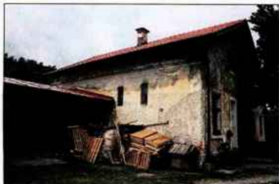
Naklo - okolica nekdanje železniške postaje ni urejena.

Med manjšimi gorenjskimi občinami je nakelska vzorno urejena. Vseeno se najdejo črne točke, ki kazijo videz krajev. Čeprav je skrb za stavbe in okolico dolžnost lastnikov, bi vodstvo občine lahko ukrepalo vsaj pri dolgo nerešenih problemih. Nekaj takih primerov razkrivajo spodnji posnetki. S. S.