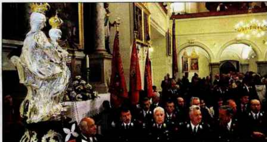
Med Florijanovo mašo v Tržiču so blagoslovili obnovljen baročni kip Marije.