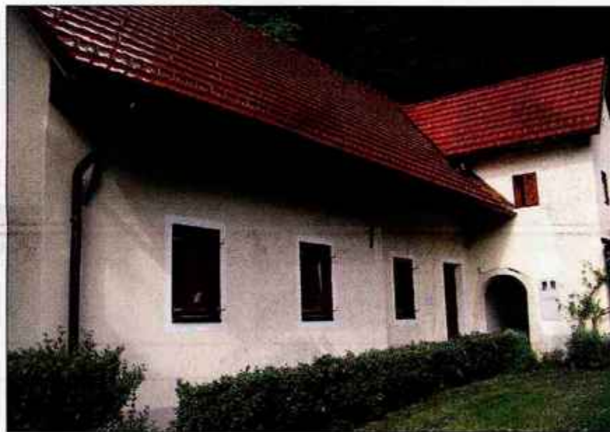
Rojstna hiša Jakoba Aljaža na zunaj že kaže novo podobo.

Jakob Aljaž se je rodil 6. julija 1845 v Zavrhu pod Šmarno goro, po domače pri Bačniku, in 6. julij je praznik občine Medvode. Slednja že nekaj let obnavlja njegovo rojstno hišo, ki naj bi bila memorialni spomenik odprtega tipa, natančna vsebina pa še vedno ni znana. Obnova se je začela leta 2003, ker pa se je pokazalo, da je hiša, ki je sicer stara prek 200 let, precej dotrajana in da bo treba opraviti večje posege, so morali pri-