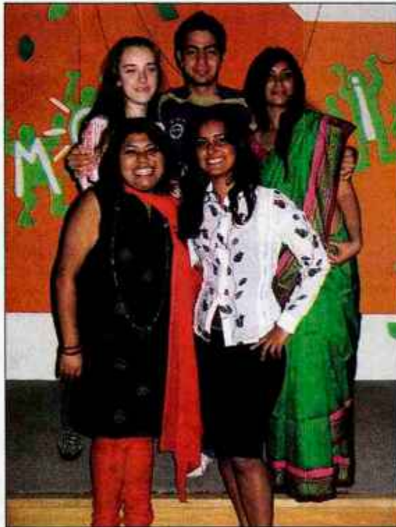
Tuji študentje, ki jih gostijo na gorenjskih šolah in vrtcih.