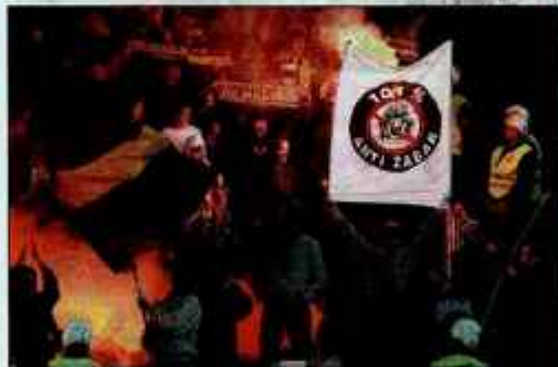
Odziv Vijol ne potrebuje komentarja.