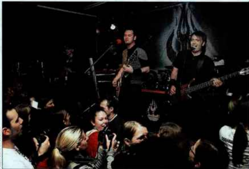
Rdeča Ostriga je ob koncertu Siddharte gostila evforično množico njenih navdušencev.

K aj je tisto, kar privablja trume mladih in starih, predvsem pa deklet na koncerte skupine Siddharta , ki so sposobni napolniti do zadnjega kotička prav vsako dvorano? Mogoče medijska nedostopnost, saj razen preko založbe, novinarjem praktično ne dajejo izjav, ali pa vrsta viktorjev, ki so jih do sedaj prejeli za dosežke na glasbenem področju. Še najbolj verjetno pa je to, da so enostavno dober bend. Bend s karizmo, z različnimi, kakovostnimi nastopi v živo, dobro vizualno podobo, poslušno glasbo in predvsem dobro ekipo v ozadju. Po uspešnih mega koncertih in predstavitvi albuma Petrolea so nadaljevali z manjšimi klubskimi turnejami po Sloveniji, kjer so nastopali predvsem za študentske klube. Tako so se miruli petek ustavili tudi pri skofje-