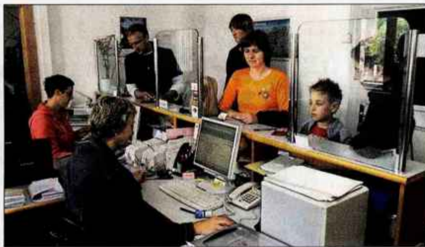
Pri osebnih dokumentih so na kranjski upravni enoti od šestih okenc delala štiri.

V največji upravni enoti na Gorenjskem, v Kranju, so bili nad precejšnjim obiskom v soboto prijetno presenečeni. Nanj so se dobro pripravili, saj je delalo 17 uslužbencev, največje število na