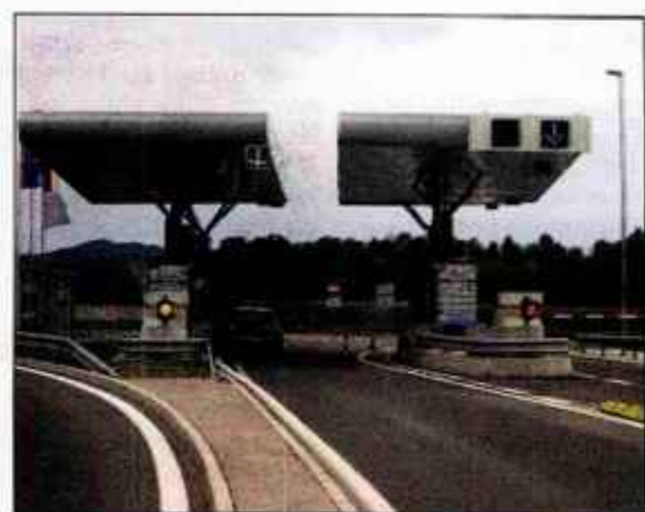
Cestninska postaja v Krtini je zelo dobro varovana, zato so mladega nepridiprava policisti prijeli še isti dan.

Mlada nepridiprava sta se svojega podviga, kot kaže, lotila zelo naivno, saj sodijo cestninske postaje med zelo varovane objekte. Kot so sporočili z DARS-a, do ropa cestninske postaje v Sloveniji še ni prišlo. "Po našem mnenju cestninske postaje tovrstnim dejanjem niso zelo izpostavljene predvsem