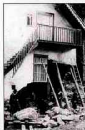
Posledice poplave leta 1926 (Arhiv družine Treven, Lanke)

dva metra snega, višje še precej več. Prebivalci od 15. do 60. leta so morali na glavni cesti proti Fužinam odmetavati sneg, vsak po 25 metrov. Leta 1976 je kraj stresel precej močan potres. Leta 1985 je drevesne veje za tri tedne objel