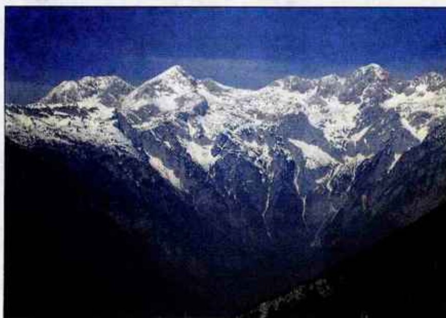
Pogled proti verigi Kamniških Alp

Pot je nezahtevna. Za omenjeni vzpon in spust boste potrebovali približno 4 ure. Pozor na poti velja le zaradi "spustašev". Naostrite ušesa in napnite oči, pa srečkov komaj zavil.