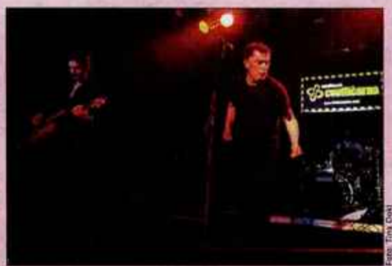
Vaya Con Dios (več koncertov maja in junija) in na Iron Maidne (stadion za Bežigradom, 2. junija), ki tudi prihaja v Slovenijo. A. B.