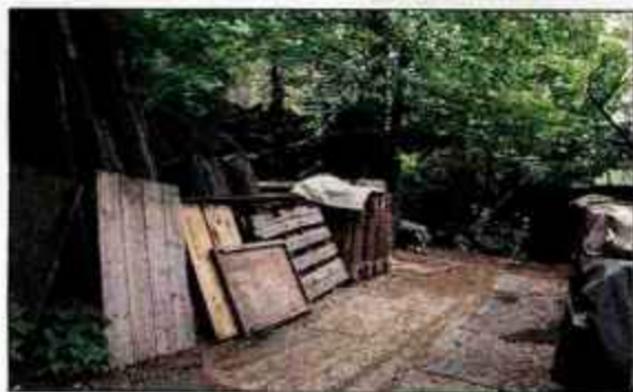
Strahinj - nered na dvorišču hiše ob poti proti Tenetišam