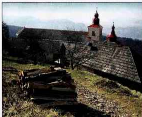
Cerkev svetega Primoža nad Kamnikom

Pot se na začetku dviguje zložno, potem pa v strmih okljukih. Uf... sapa in povišan pulz ..., a ko dosežete sleme, ki se odpre na Malo in Veliko planino, je "ta hudo" že za vami. Zagrizla sem naprej proti Pirčevemu vrhu, ki je bil, mimogrede, čista neznanca oskrbniku v koči na Primožu. Pot, ki se spusti proti širokemu gozdnatemu sedlu, namreč preči Pirčev vrh in z njegovega temena niti ni nobenega razgleda, ker je obraslo z drevjem. Spustila sem se na sedlo in po spodnji poti, preko Pasjih peči, prišla nazaj na sleme, ki nudi lep razgled na Kočno, Grintovec, Dolg hrbet in Skuto. Na deblu, ki mi je služil za klopco, sem si privoščila malico in kar naenkrat zagledala, da se je po poti preko Pasjih peči pripeljala skupina spustašev, skupina z downhill kolesi. Zapodili so se preko skalnate poti navzdol. Morda bi veljalo nekje postaviti opozorilno tablo, da je ta planinska pot