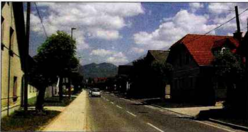
Kanalizacija je zgrajena že v skoraj celotnem Šenčurju.