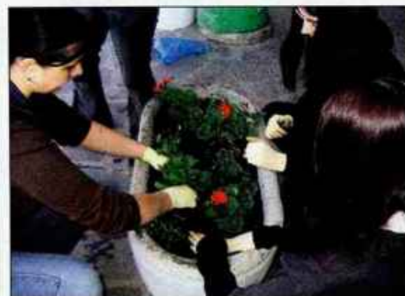
Radovljiške dijakinje so polepšale tudi korita z rožami.

Radovljiški dijaki radi prispevajo k čistejšemu okolju in skušajo k temu spodbuditi še druge, zato so tudi tokrat ob dnevu Zemlje na Srednji gostinski in turistični šoli v Radovljici imeli eko dan. In česa so se lotili tokrat? Najprej so se razdelili v skupine, ki so jim dodelili posamezne naloge. Nekateri so čistili okolico šole, drugi glavno avtobusno in železniško postajo ter stadion. Na smetnjake so nalepili napise "razno", "plastika" in "papir", polepšali so tudi korita z rožami. Del dijakov je obiskal čistilno napravo v Radovljici, dijaki prvih letnikov pa Bio park Nivo na Štajerskem. Poskrbeli pa so tudi za bolj prijazno šolo: očistili so klopi, lepili razpadle atlase, izdelovali plakate o filmu Neprijetna resnica, v kuhinji so pripravili namaze s kalčki in skuto ... Skratka eko dan je bil zelo pester in tako ni čudno, da so nekateri dijaki menili, da bi ga morali imeti večkrat na leto. Nad njihovo akcijo so bili navdušeni tudi krajanje. A. H.