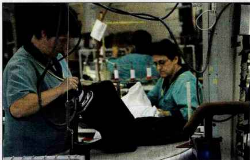
Nekaj delavk bo na zavodu za zaposlovanje počakalo do upokojitve, kaj pa ostale?