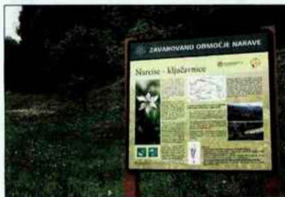
Tako obsežnih narcisnih poljan, s kakršnimi se lahko pohvalijo v jeseniških rovtih, ni nikjer na svetu. Narcise so zavarovane in jih ni dovoljeno trgati.