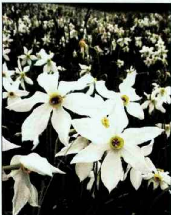
Narcisa ima več kot 120 različnih imen, domačini v jeseniških rovtih ji pravijo ključavnica. Vsako leto ne cvetijo enako bujno, letos jim je precej škodila suša.