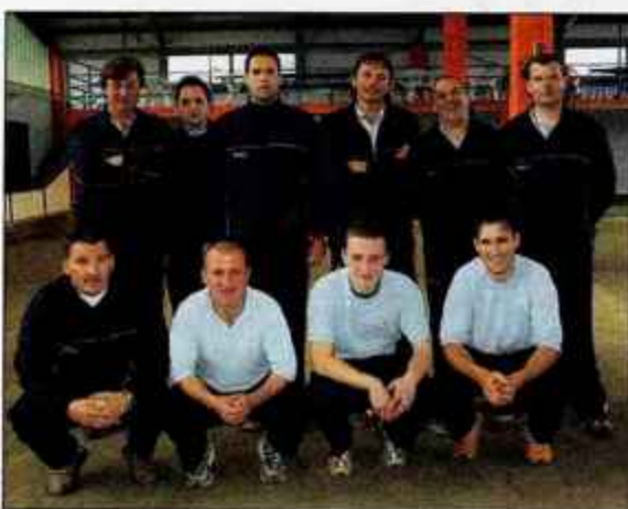
Balinarji Planine Kranj so prvi del super lige končali s šestimi točkami zaostanka za vodilno Zarjo Balinčkom.