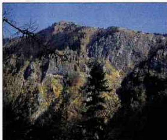
Do Velike planine vodi markirana pot preko Male planine.

tudi spustaška steza za downhill kolesarje. Kljub temu, da sem tudi sama navdušena kolesarka, se mi resnično ne zdi primerno, da se z downhill kolesi spuščajo po običajnih urejenih planinskih poteh. Ko sem se vračala navzdol, sta me prehitela še dva, od katerih je eden sprožil celo gručo kamenja in na enem od ovinblo, da je ta planinska pot