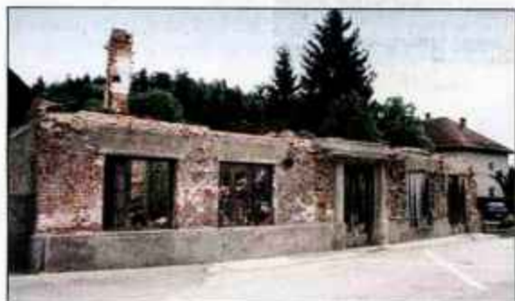
Spodnje Duplje - ruševine stare hiše ob poti v šolo