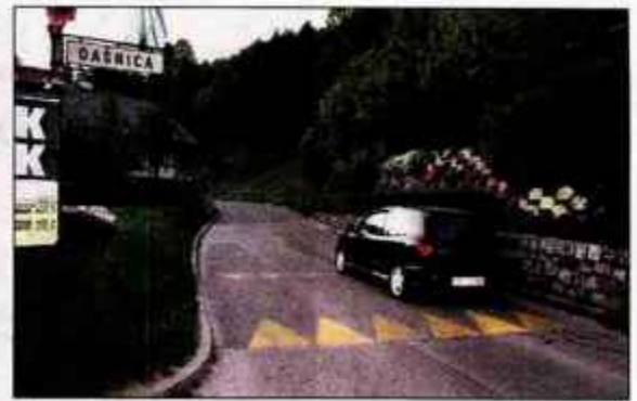
Odstranitve treh hitrostnih ovir se bodo nekateri krajanje Dašnice razveselili bolj, drugi manj.