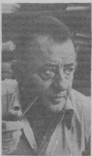
direktor DO Kemična tovarna Moste — Protektor.