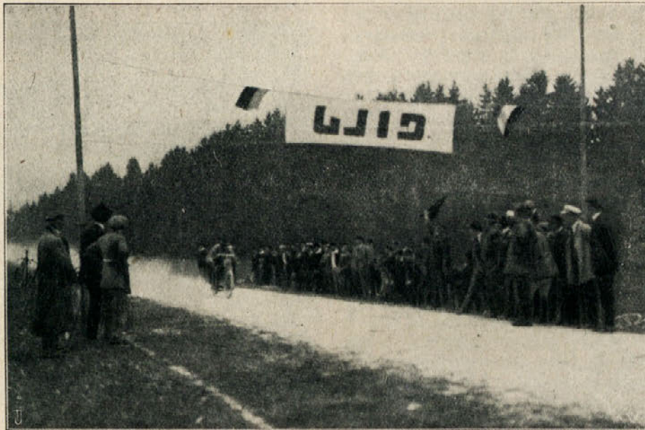
Cilj pri motorni hitrostni dirki Kranj—Medvode.

zvezdna dirka na Celje, katere se je udeležilo 74 dirkačev in ki je bila največja dirka v letu; gorsko prvenstvo Slovenije; zvezdna dirka v Ljubljano o priliki velesesja; handicap-dirka v Ribnico. Vrh tega za Sportno zvezo prvenstveni cestni dirki na 1 in 10 km motorno hitrostno dirko na 10 km in za Savez gorsko prvenstvo Jugoslavije ter za dirko za jugoslovansko cestno prvenstvo start in nadzor proge po Sloveniji. Od klubov je priredila Ilirija 15 dirk, Ježica 5, po 3 dirke Novo mesto, Šoštanj, po 2 Celje in po 1 Zvezda in Mariborsko kolesarsko društvo. V celoti smo imeli letos v Sloveniji 37 kolesarskih dirk s prevoženimi 1582 km ter dve motorni dirki. Vrh tega so startali dirkači podsaveza na eni mednarodni dirki in na osmih dirkah v Zagrebu, oziroma prirejenih po Savezu. Sportno gibanje je bilo tedaj napram preteklim sezonam jako močno ter smemo biti z uspehom zadovoljni. Zelo so otežkočala delovanje podsaveza nespretno sestavljena pravila Saveza, ki onemogočajo podsavezu samostojno delovanje, iz Saveza samega pa tudi ni bilo zadostne iniciative in zadostnega dela. V tem oziru bo treba za bodoče temeljite izpremembe. — Odbor je imel v sezoni štiri redne seje in številno sestankov. Tajništvo je prejelo nad 40 dopisov, razposlalo jih je pa nad 120. Med letom se je pojavil dvom o potrebi podsaveza, nakaž je razposlal podsavez primerno okrožnico na vse klube. —