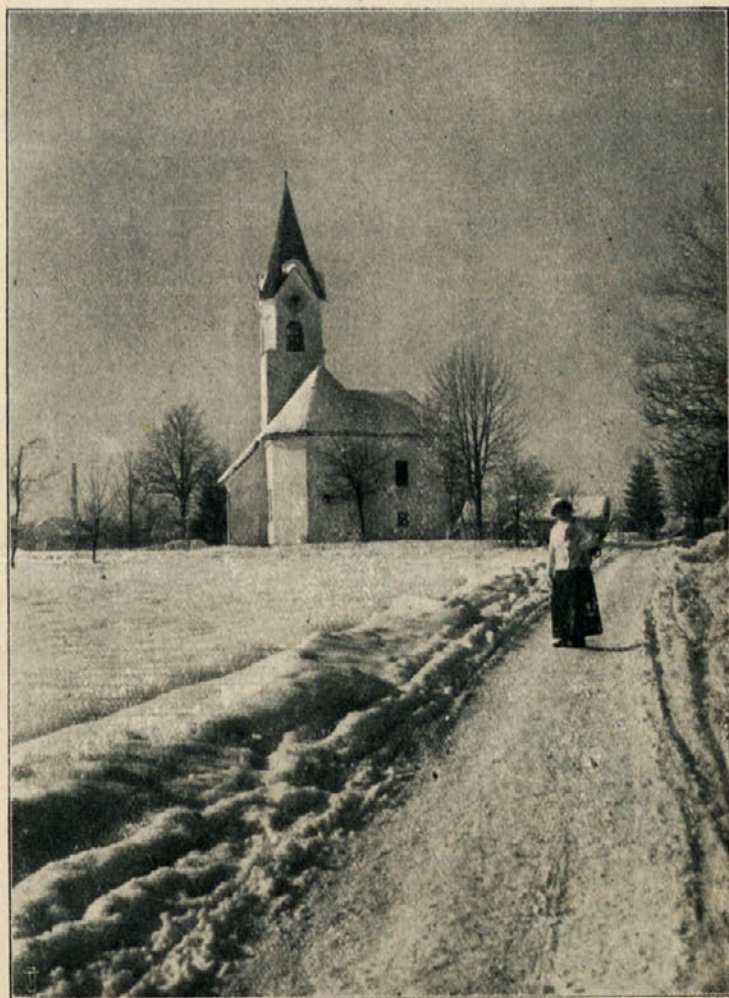
Sv. Katarina nad Medvodami.