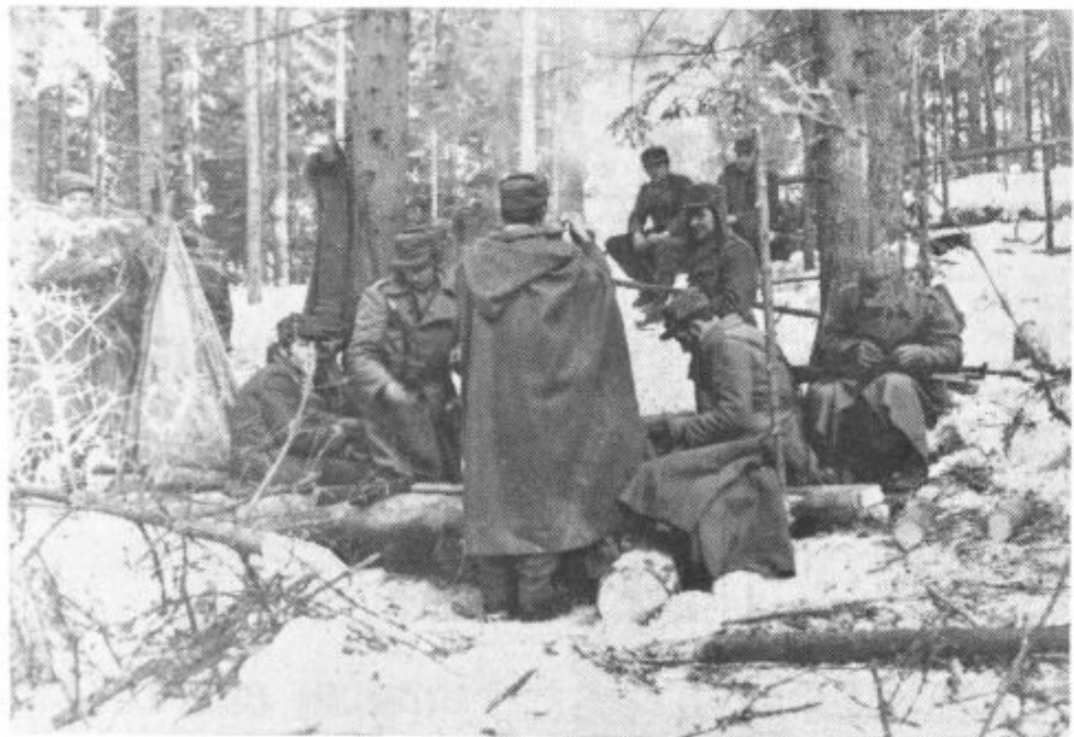
Tabor sredi zasneženega gozda

Komandir je zadnjič kontroliral s karto in kompasom v roki, če smo prišli na pravo mesto, nato smo hitro poiskali primeren prostor za tabor in pričeli z delom. Skoraj nevidna sled dima med smrekami je oznanjala da je kuhar že pričel taliti sneg za golaž.