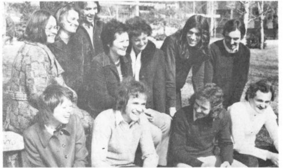
POMLAD JE TU — Minevajo dnevi in z njimi tudi letna obdobja. Tako smo pred dnevi znova pričakali pomlad, ki se je na srečo pričela s soncem. Slovenski poet je zapisal: »Pa vse rože cveto, pa vsi ptički pojo, naj bo dolgo tako...« Pomladni meseci so čas, ko se prebuja narava, ko ljudje prilezemo na plano in mislimo na lepše. Pomladni čas je čas ljubezni in mladosti. Predvsem mladim je namenjena pomlad, zato smo tudi naslovno fotografijo namenili njim.

23. marec 1973 • Leto IX., št. 5 (176) • Cena 1 dinar • Poština plačana v gotovini