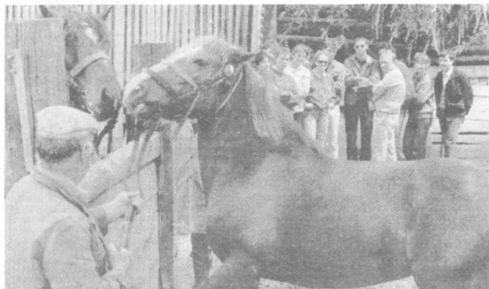
Pomladna idila se seli tudi v živalski svet!

Prvi polčas je mimo, bo drugi uspešnejši? JANJA DOMITROVIČ