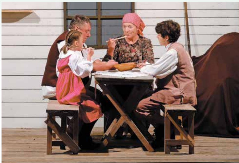
Tinkara in Kecek z atom in mamo