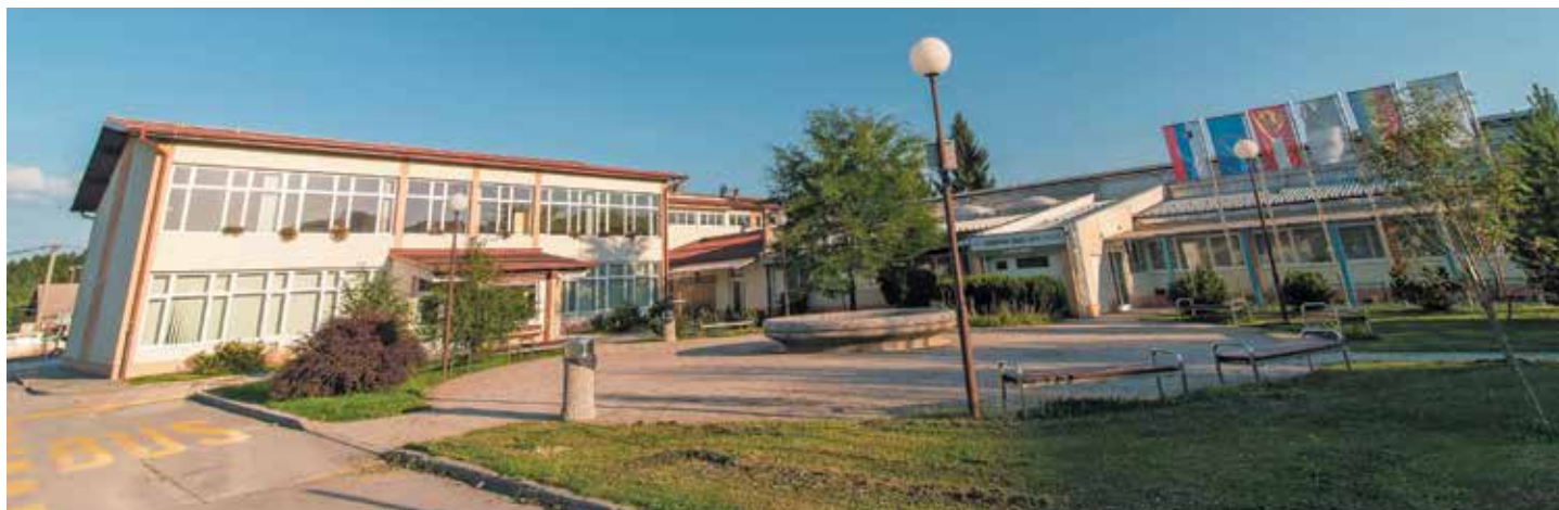
8 talcev in Tabor je slikal Miran Antončič, Rovte arhiv šole

Šolske klopi so se te dni tudi v Logatcu napolnile s šolarji, mnogi so šolski prag prestopili prvič. O vse večjih generacijah otrok v naši občini govorimo že nekaj let, kar je za kraj in regijo, seveda, spodbudno. Kakšne novosti se obetajo v tem šolskem letu, koliko prvošolčkov je prestopilo prag hiše učenosti, o azilantih in napovedanih spremembah za prihodnje šolsko leto sem na začetku počitnic povprašala ravnateljici in ravnatelja logaških šol.