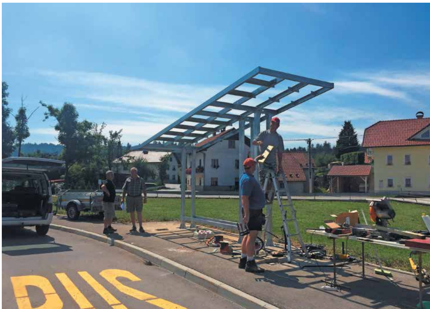
Pokrito avtobusno postajališče na Martinj Hribu

V novič obratuje bankomat v Gornjem Logatcu. – Asfaltacija Rožne ulice na Martinj Hribu ter modernizacija lokalne ceste LC 226121 Rovte-Podlipa - Novo pokrito avtobusno postajališče na Martinj Hribu