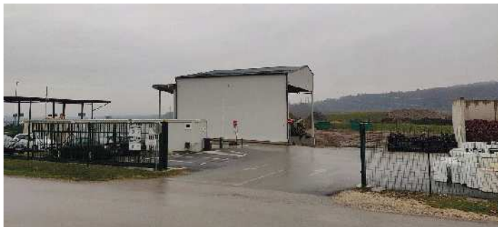
Zbirni center Dobrava

Zbirni center Dobrava se nahaja ob cesti Ormož–Sveti Tomaž v naselju Dobrava in je namenjen ločenemu zbiranju in začasnemu hranjenju odpadkov. Namenjen je občanom iz občin Ormož, Sveti Tomaž in Središče ob Dravi, ki so vključeni v redni odvoz odpadkov. V zbirnem centru so nameščeni zabojniki, označeni s tablami, kamor občani lahko brezplačno oddajo različne vrste odpadkov. Za določene vrste odpadkov pa veljajo količinske omejitve in so presežne količine odpadkov plačljive (gradbeni odpadki, izolacijski materiali, različne kritine).