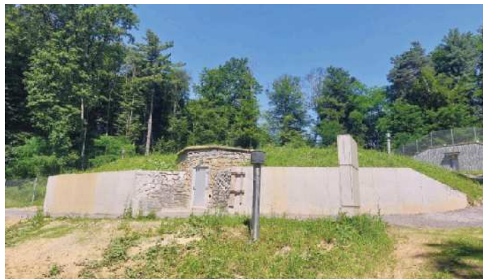
VH Hajndl iz leta 1965 je bil obnovljen od znotraj in zunaj.