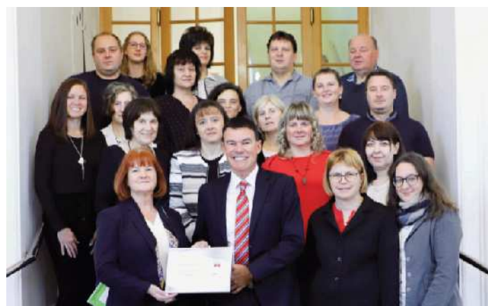
Zaposleni na UE Ormož

Skupni ocenjevalni okvir v javnem sektorju CAF (Common Assessment Framework) je orodje za celovito obvladovanje kakovosti, ki ga organizacije v javnem sektorju po vsej Evropi lahko enostavno uporabljajo z namenom, da bi izboljšale svoje delovanje. Zasnovan je na predpostavki, da se odlični rezultati delovanja organizacije, državljanov/odjemalcev, zaposlenih in družbe dosežejo s pomočjo strategije vodstva in z načrtovanjem, zaposlenimi, s partnerstvi, z viri in s procesi. Model daje poudarek večji vključenosti zaposlenih pri predlaganju in izvajanju sprememb, sodelovanju, preglednosti delovanja in notranji povezanosti organizacije. Končni cilj uporabe modela