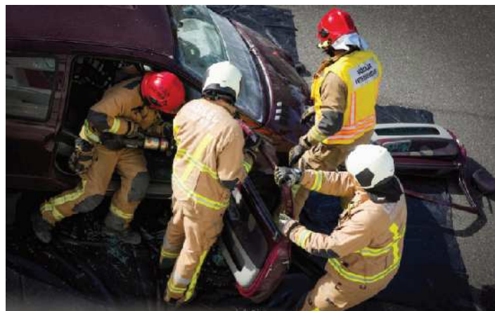
Prikaz ob posredovanju v prometni nesreči na dnevu odprtih vrat