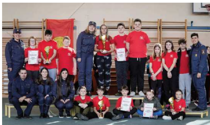
Občinski kviz gasilske mladine v Središču ob Dravi

Vredno je omeniti še nekaj dejavnosti, ki jih redno vključujemo v naš letni načrt dela in jih izvajamo med