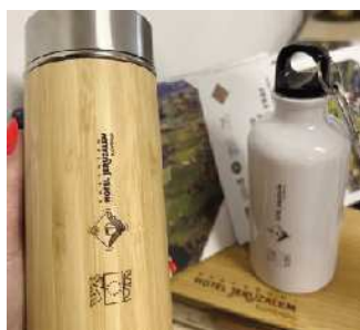
Maruša Mohorčič, IZ TKŠ Občine Ormož

Vrednost operacije je 72.908,21 evrov, sofinanciranje 42.000,29 evrov (vse tri občine), lastni delež 2.911,00 evrov (promocijski material za destinacijo Jeruzalem Slovenija –