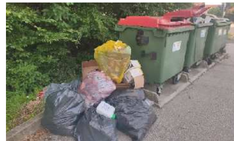
Nepravilno odloženi odpadki na ekološkem otoku

Ob prihodu v zbirni center vas sprejme upravljalec zbirnega centra in vas seznanji z načinom oddaje odpadkov. Nato uporabniki zbirnega centra sami po navodilih razvrstijo svoje odpadke po označenih zabojnikih. Za lažje in hitrejšo razporejanje pripeljanih odpadkov v ustrezne zabojnike je priporočljivo, da si