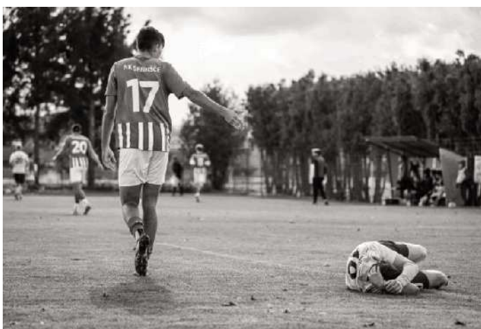
Tekma NK Središče ob Dravi - NK Avto Rajh Ljutomer

Veterani so se po nekaj medlih nastopih v uvodu v sezono vendarle zbrali in na nekaj srečanjih pokazali, da spadajo med boljša veteranska moštva v MNZ Ptuj. Pogled na lestvico še ni tako razveseljujoč, kot bi si želeli, a vse se lahko spomladi hitro popravi.