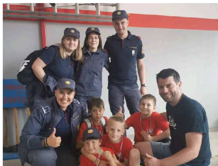
Regijsko tekmovanje iz orientacije v Spodnji Polskavi

pripravami na tekmovanja in samimi tekmovanji. Leto pričnemo z zborom mladine, ki izgleda povsem enako kot občni zbor društva, edina razlika je le ta, da zbor v celoti vodijo in izpeljejo otroci. V spomladanskem času se lotimo tradicionalnega pletenja mladinskega presmeca, ki ga na cvetno nedeljo odnesemo k farni cerkvi na Grabe. Ne uide nam niti čistilna akcija v sklopu čiščenja občine, saj se pridružimo članom in članicam društva ter jim pomagamo očistiti traso od mejnega prehoda do bencinske črpalke. V začetku maja praznujemo god našega zavetnika svetega Florjana, ki ga počastimo z obiskom svete maše in s Florjanovim pohodom. Ob koncu šole že tradicionalno izvedemo naš tabor mladine, ob koncu počitnic pa se odpravimo še na tabor k našim prijateljem iz PGD Sela. Poletne vaje so zelo sproščene in zabavne, ker vključujejo igranje nogometa, špricanje z vedrovkami, peko koruze in različne športno-gasilske poligone z igrami. Meseca oktobra se udeležimo dneva odprtih vrat našega društva, prisotni smo tudi na dnevu gasilcev Gasilske zveze Središče ob Dravi, ob koncu leta pa naše članice razveselimo z obiskom delavnice izdelovanja adventnih venčkov. Vsako leto za podmladek organiziramo tudi zaključni izlet.