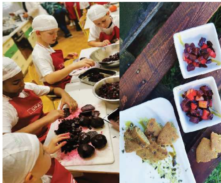
UTRIP V VRTCU IN ŠOLI

Učencem smo ponudili bučno »postržjačo«, solato iz rdeče pese in jabolčk, z bučnimi semeni in bučnim oljem ter bučne kolačke.