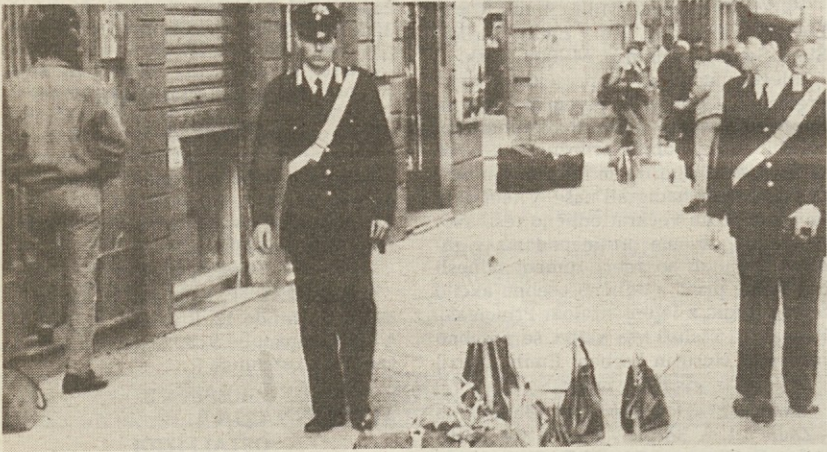
V Firencah so okrepili patrulje sil javnega reda predvsem v ulicah, kjer so tuji priseljenci najbolj številni