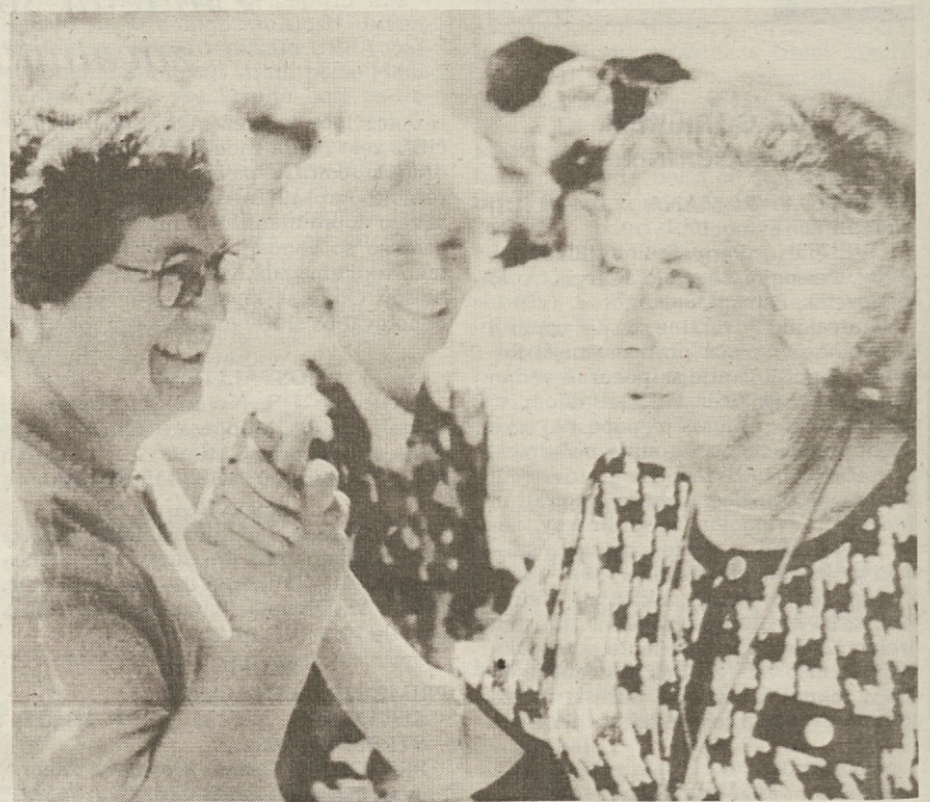
Vdova bivšega čilskega predsednika Salvadora Allendeja Hortensia Bussi se je včeraj vrnila v Santiago po 16-letnem bivanju v izgnanstvu