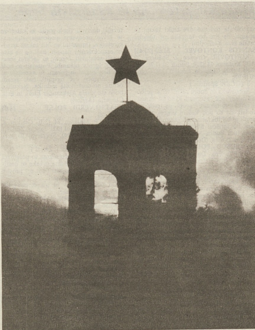
Posnetka sta današnja: rdeča zvezda zahaja v vseh evropskih državah, razen v Albaniji, kjer še trdno

stoji na vseh cerkvah in mošejah, ki so jih leta 1967 spremenili v muzeje ali kinematografe; al-