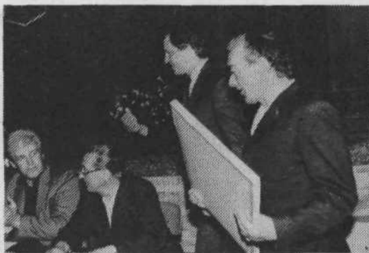
Krajani Stare Ljubljane so se gostiteljem zahvalili za pripraven sprejem in jim v znak spoštovanja podarili sliko – grafiko akademskega slikarja Ive Šubica.