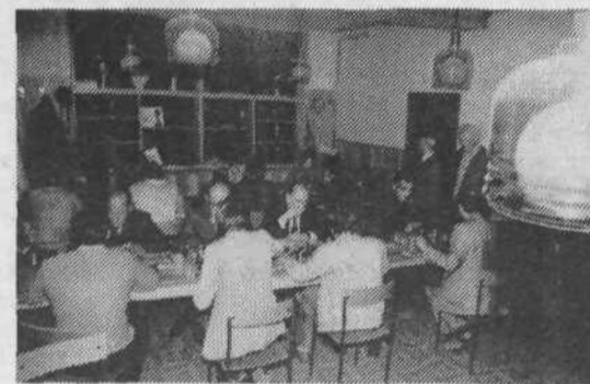
Poleg številnih drugih športnih panog so se krajanji pobratenih KS pomerili tudi na črno-belih poljih.