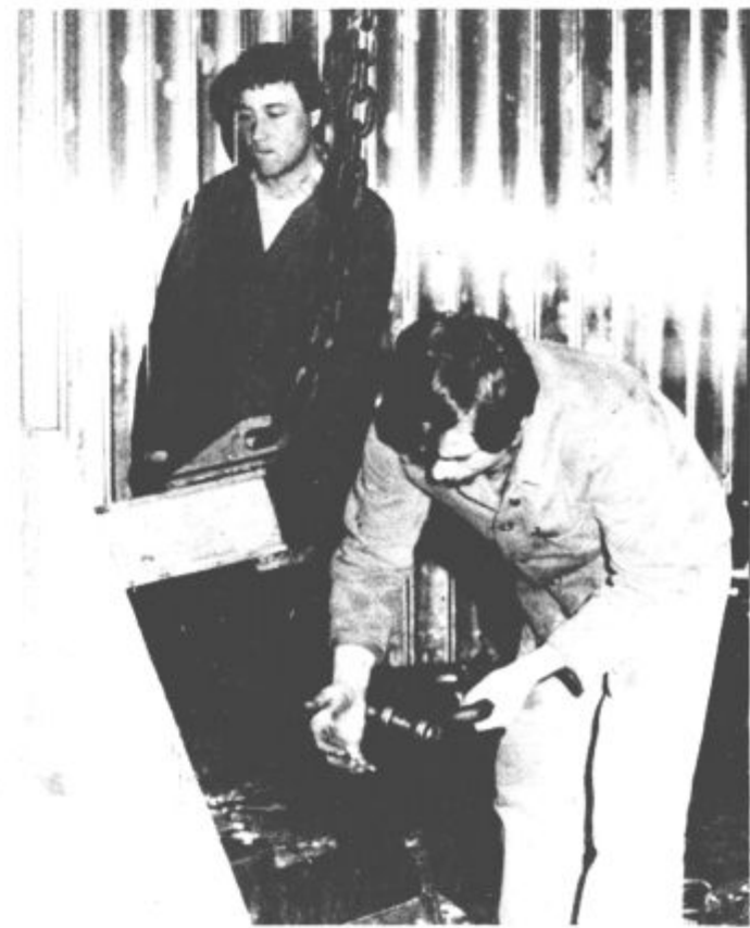
Varstvu pri delu bodo v bodoče posvetili še več pozornosti