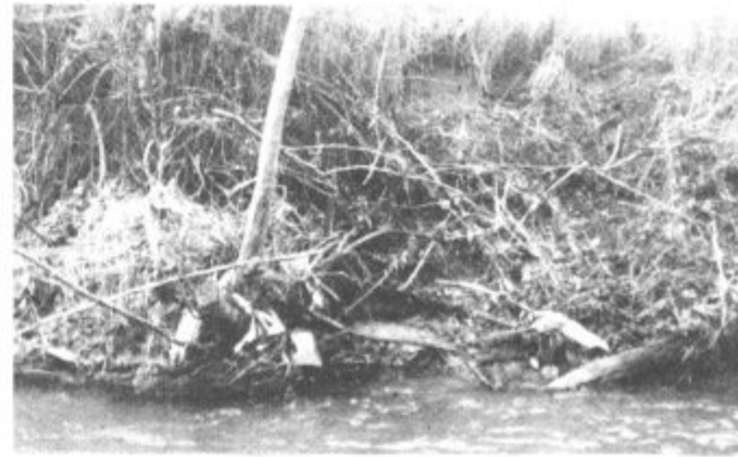
Onesnažena Pečovnica, Paka pa ni nič lepša