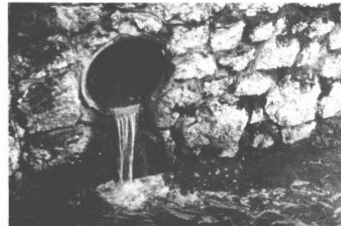
Odplake nas vedno bolj ogrožajo