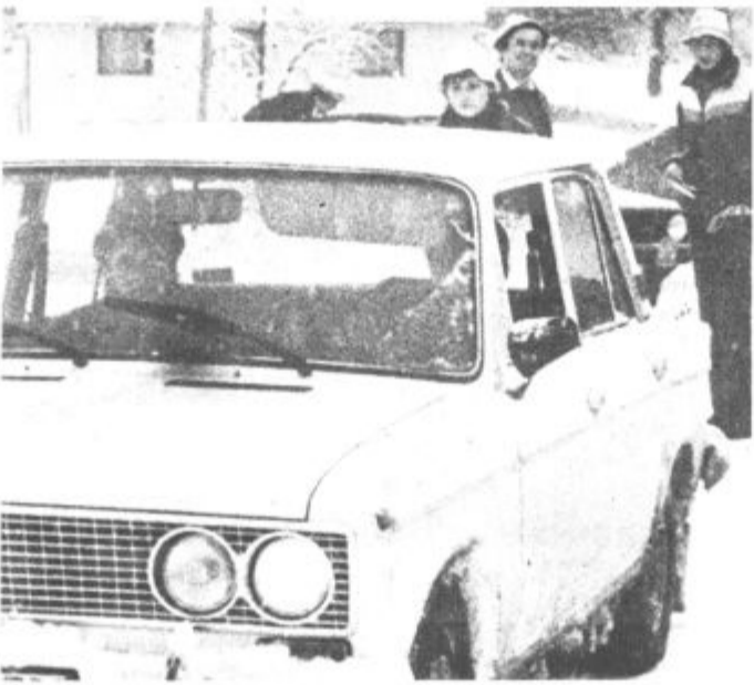
Ob pregledu ustavljenih vozil najdejo največ napak na svetlobnih telesih