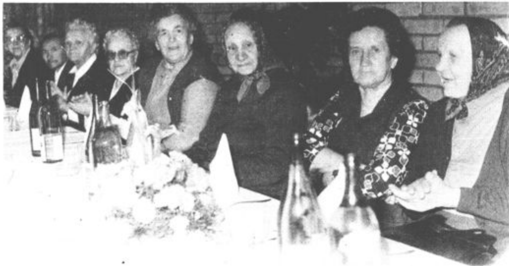
Najstarejši krajan Desnega brega so se srečali letos prvič.