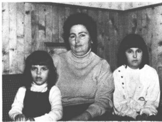
»Mama in ata sta zelo dobra. Radi ju imava«

Kateri je glavni razlog, za odločitev, da bo »krušna« mati otrokom, ki so jih starši zapustili iz takšnih ali drugačnih vzrokov. Pred 10 leti je slišala objavo na radiu, njeni otroci so že vsi odrasli, predvsem pa ima levji delež pri tem ljubezen do otrok. »Zelo rada jih imam, drugače se za rejništvo ne bi nikoli odločila. Vloženega truda ne more