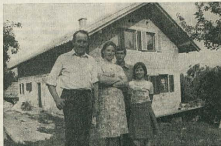
Družina Karlavec pred obnovljeno hišo