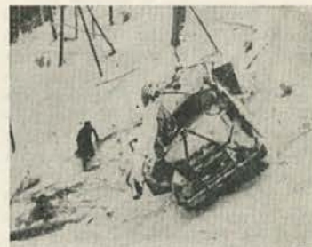
MAN — razbitina

Ko sem že pri cestah, naj opozorim na nekaj še naše načrtovalce in graditelje le-teh. Vedno več je upravičenih pripomb šoferjev na gradnjo gozdnih cest. Te so sicer dobre, ovinki ustrezajo sposobnostim vozil, ni pa prostorov za izogibanje in obračanje. Kamioni morajo obračati tudi na takšnih mestih, da se slučajnemu opazovalcu ježijo lasje. Takšno obračanje pa seveda ne ostane brez posledic. V zadnjem času smo imeli več primerov zloma priklopa na vozilu. Prikolica se je na lepem odtrgala in odšla