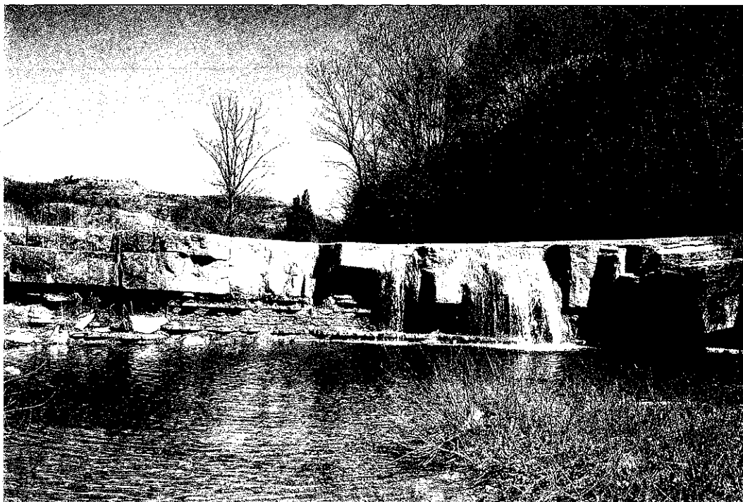
Sl. 2 - Škrlina na Rokavi. 50 m pred izlivom v Dragonjo se voda Rokave v slapju pretaka prek nazobčane izklynjene plasti apnenčevega peščenjaka.

V približno dveh tretjinah svojega toka, od izvira do vtoka Krkavškega potoka, je Dragonja zarezala strugo v prodne nanose. Prod je flišnega izvora, predvsem ostanek odpornejših plasti apnenčevega peščenjaka in peščenjaka. Prodišča so posledica