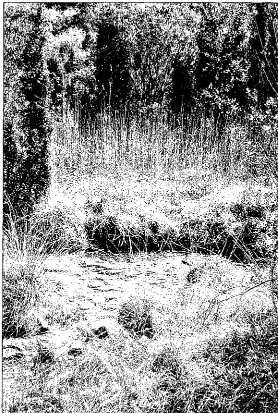
Sl. 3 - Tik nad vtokom Pasjoka v Dragonjo so ob vznožju pobočja danji izviri. Že od daleč so razpoznavni po sestoji trstja ( Phragmites communis ). Fig. 3: Just before the inflow of the Pasjok stream into the Dragonja River there are springs at the foot of a hill. They can be easily recognised from far away by a characteristic composition of reeds ( Phragmites communis ).

Posebnost med izviri v dnu doline Dragonje so danji izviri pod pobočjem Vela reber in pri vtoku Pasjoka v Dragonjo. Kakor ob zastajajoči vodi med balvani se tudi ob teh izviri pojavljajo biotopi, razpoznavni po sestoji trstja (sl. 3).