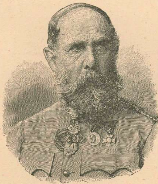
Nadvojvoda Karol Ludovik, zaščitnik češke akademije ved in umetelnostij.

In kako vstajenje, kakšna Velika nedelja se je praznovala potem v Dobropoljah! V svojem govoru je prosil župnik vse tiste, ki so še v zmoti, naj se povrnejo nazaj v naročje katoliške cerkve. Večina luterancev ga je slušala in posnemala njegov vzgled. Tudi po hišah se je vršila sprava, kjer je poprej vladal razdor, in poljubljali so se od