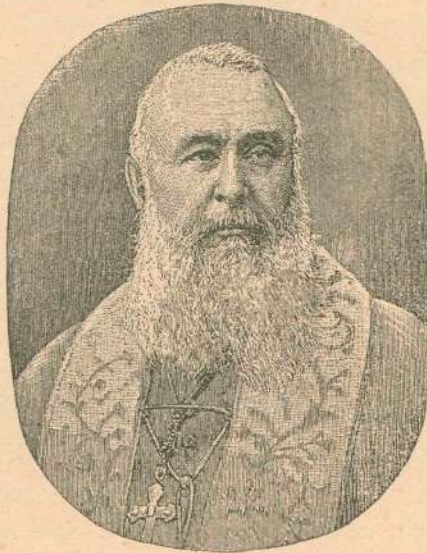
Kardinal Karol M. A. Lavigerie, načelnik proti-suženjskega gibanja.

Med Dobropoljci so se širile razne govornice o župniku Luki in o slepem Pongreu — Šobi. V obče so se bistveno vse vjemale v tem, da je Šoba kopal Luki jamo in sam padel vanjo. Luteranci so pa zagnali strašanski hrup, češ, da so katoličani ubili predikanta. Potegovali bi se bili zanj še bolj, ako bi se ne bilo zvedelo, kako je ravnal s Pavšalkom. Tako je bilo ljudstvo zo-