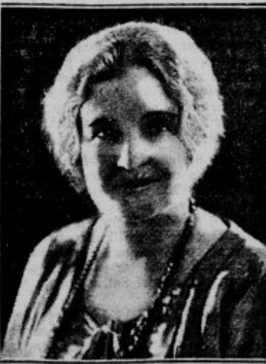
V nastovni vlogi