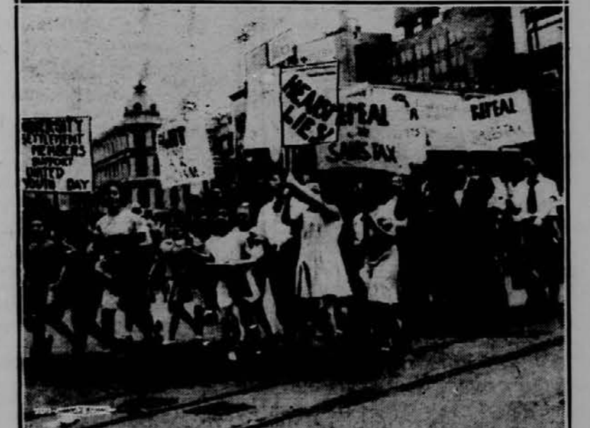
Na Spominski dan so se vršile v New Yorku velike parade, ki pa niso bile vse istega značaja. Na sliki vidite skupino šolske mladosti, ki z napismi protestira proti vojni in proti onim, ki bi rali pahnili deželo v vojno.