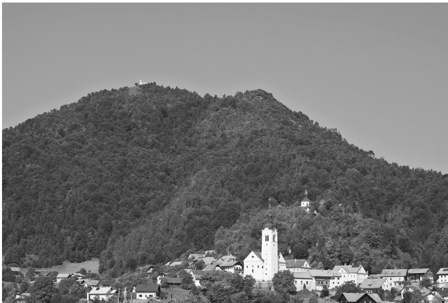
Polhov Gradec s Polhograjsko Goro v ozadju.