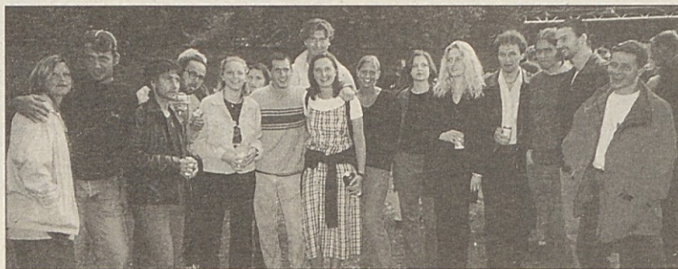
Člani kluba koroških študentov na Open air koncertu dr. Kurt Ostbahna v Celovcu.