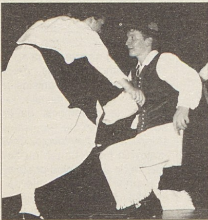
Žitajska folklorja je praznovala.

SPD „Trta“ je pretekli petek vabilo na „Folklorno noč“, ki je bila hkrati tudi zadnja prireditev v okviru nadvse uspešnega „Open aira 99“.