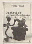
Vinko Ošlak, Postati ob knežjem kamnu, eseji in članki, Mohorjeva Celovec 1999.

skega izročila. Skupaj z orisom zgodovine 11. stoletja se nam vtisne verodostojna slika izredne osebnosti in s tem prava podoba svetnice, ki jo častimo v alpsko-jadranskem prostoru.