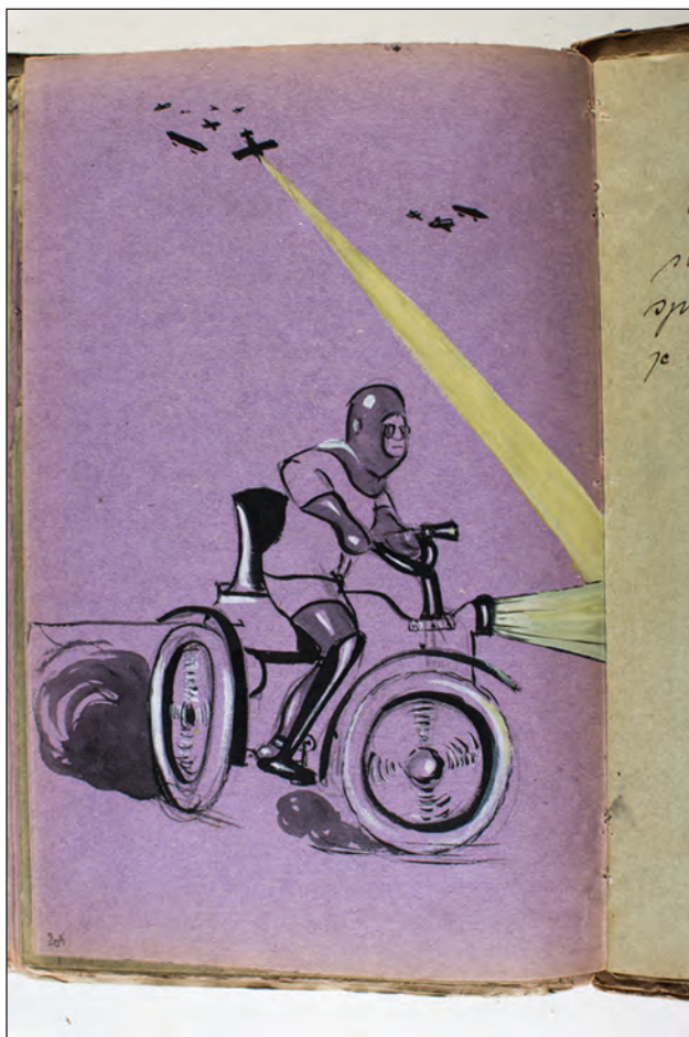
A. Motika, Put na Mjesec / Il viaggio sulla Luna / Journey to the Moon (1917.-1919.), Zbirka umjetnina Grada Pule, Pula

publikacija, u izdanju Matice hrvatske, Od zemlje do mjesece ravan je put/ Oko mjesece datira iz 1875. godine, s reprintom iz 1907. Za vrijeme autorova boravka u Pazinu prevedeno je i tiskano nekoliko Verneovih djela – Put oko zemlje za osamdeset dana, Ideja doktora