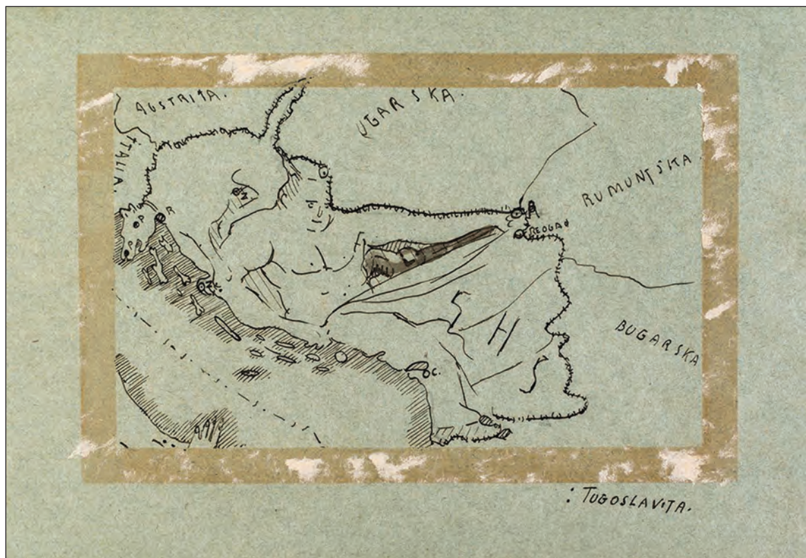
A. Motika, Moje karikature / Moje karikature / Le mie caricature / My Caricatures: „Euro Pa“ i „Jugoslavija“ (1917.), Kabinet grafike HAZU, Zagreb