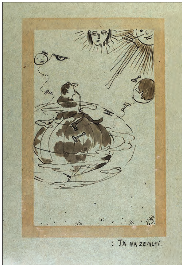
A. Motika, Moje karikature / Le mie caricature / My Caricatures: „Ja na Zemlji“ (1917.), Kabinet grafike HAZU, Zagreb

Cjelokupan likovni uradak obuhvaća razdoblje od 1902. do 1919. godine, koje nam kronološki, slijedom gradova i mjesta stanovanja – Pula, Žminj, Pula, Pazin, prikazuje autor. Ziherl je također primijetila kako Motikino ocrtavanje Životopisa u karikaturama gotovo da graniči sa sinopsisom preuzetog iz filmskog medija – „Svaki je list kadriran, a skup kadrova čini omnibus sastavljen