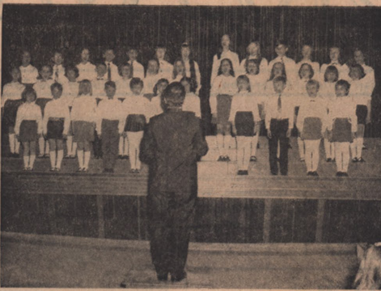
"Otroški zbor jo je urezal"

ZVESTOBA SLOVENIJI, domovinska pesem; Radovan Gobec; petje enoglasno. DOLI V KRAJU, narodna, priredil Luka Kramolc; dvoglasno. POREDNEZI, narodna, prir. Luka Kramolc; dvoglasno. BEZIMO, TECIMO, CIGANI GREDO, narodna, prir. Janez Kuhar; dvoglasno, s klavirjem.